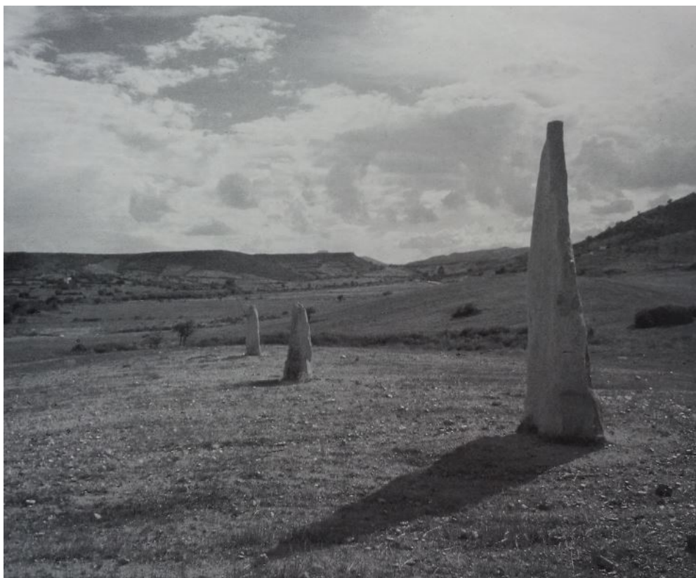
Fig. 2 - Hilera de menhire de Perda Longa - Tortoli (de ARCHEO SYSTEM 1990 a, pág. 66)).

De estas comunidades se conservan las sepulturas (domus de janas) y algunos elementos que podrían vincularse con la llamada religión megalítica, como menhires (fig. 2), rocas con hendiduras talladas, piedras sacrificiales, petroglifos (fig. 3). Sin embargo, faltan los restos relativos a los ambientes residenciales.