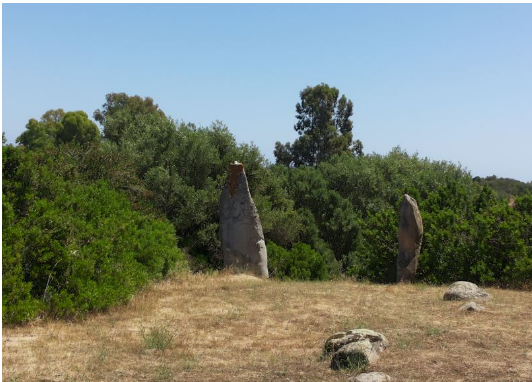
Fig. 7 - Menhires de S'Ortali 'e su Monte.