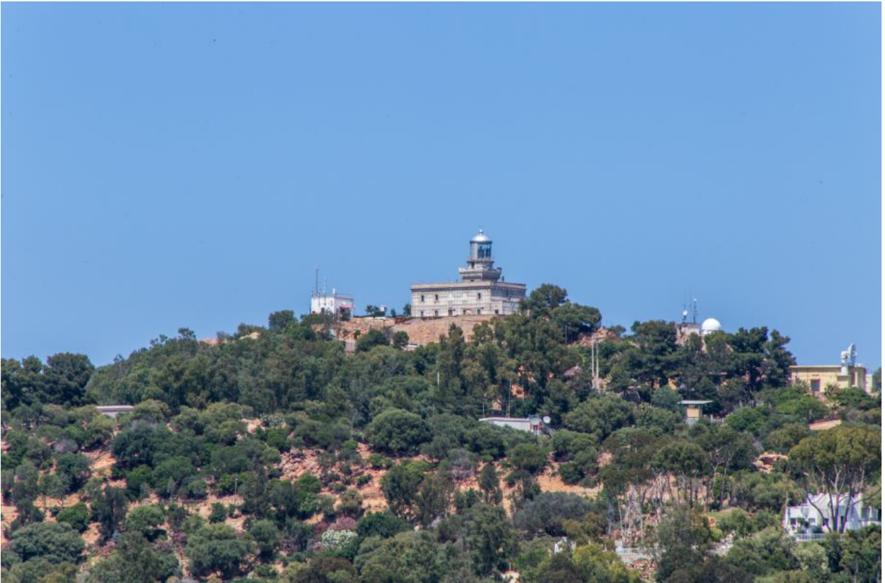
Fig. 1 - El promontorio de Capo Bellavista con el faro.

El promontorio de Capo Bellavista, a 3 km de Arbatax, alberga, a 165 metros sobre el nivel del mar, el faro de Capo Bellavista (fig. 1).