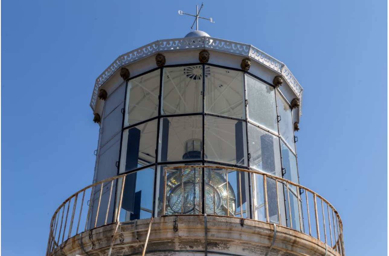
Fig. 2 - La linterna.

termina con una veleta. Los vidrios externos están decorados con pequeñas cabezas de león que ocultan el flujo de las aguas pluviales.