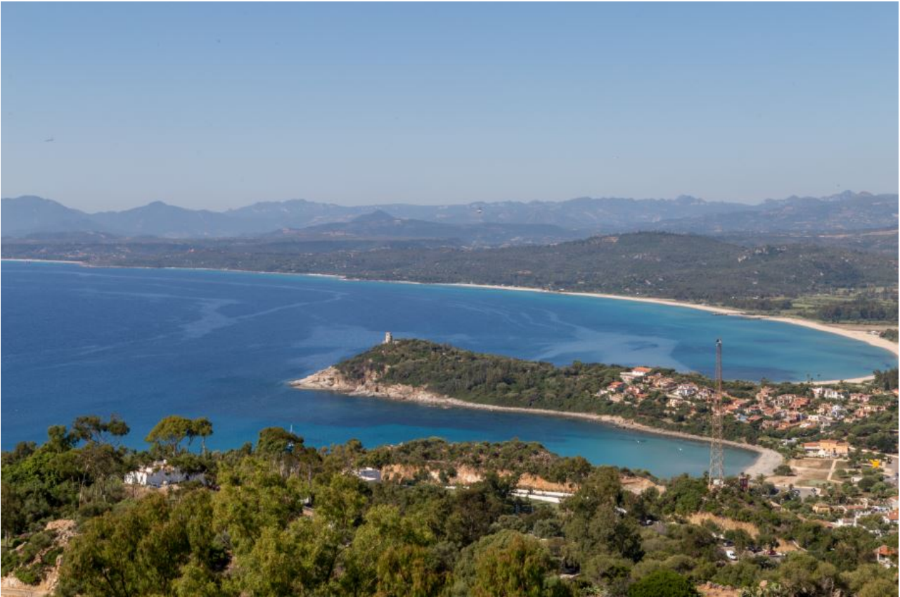
Fig. 2 - Imagen con la torre de S. Gemiliano vista desde el faro de Bellavista.

se pueden tener contactos visuales con las torres de Bari, en el sur, y la de Bellavista, en el noreste (figs. 2 y 3).