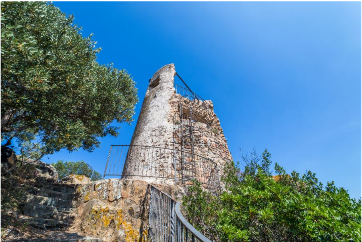
Fig. 5 - La torre de San Gemiliano vista desde el este.

Para llegar a la entrada, elevada aproximadamente a 4 metros de altura garantizaba una mejor defensa del edificio, se debía usar una escalera de cuerda o de madera (fig. 5). El ambiente donde solían estar los soldados de guardia era un pequeño espacio cubierto por una bóveda de alrededor de 13 m 2 , con dos aspilleras para las bocas de fuego. Mediante una escalera de madera, a través de una trampilla, accedían a la terraza donde estaban los cañones y donde los soldados se protegían tras los muros, es decir, un parapeto de mampostería que estaba solamente en el lado de la torre que se asomaba a tierra. La torre contaba con un alcaide , que en aquella época era el capitán de la torre, dos soldados y un arsenal formado por seis fusiles, un cañón y dos espingardas. Cesó su función pocos años después de la eliminación de la Administración Real de las Torres en el año 1842.