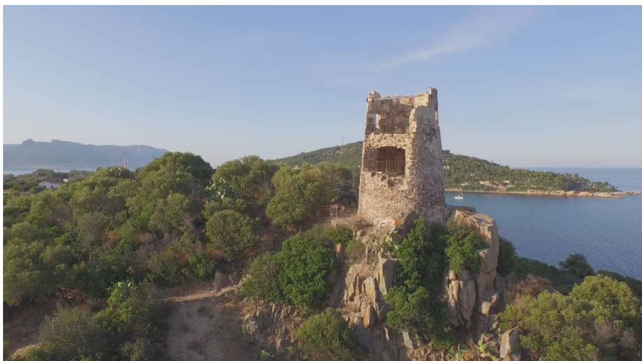
Fig. 4 - La torre de San Gemiliano vista desde el sureste.