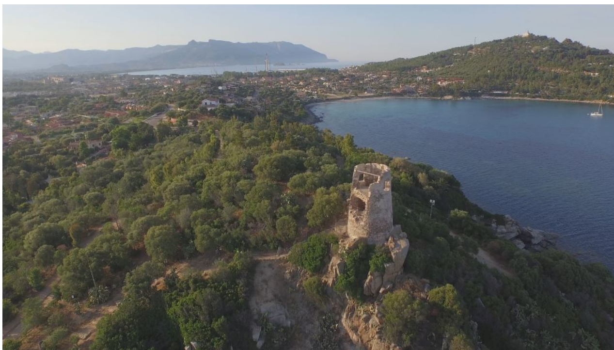
Fig. 3 - En primer plano, la torre de S. Gemiliano; en la parte superior derecha, el faro de Capo Bellavista.