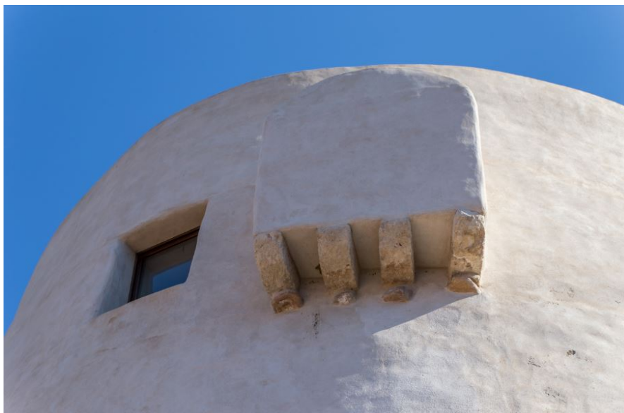
Fig. 7 - Detalle de la torre de San Miguel.