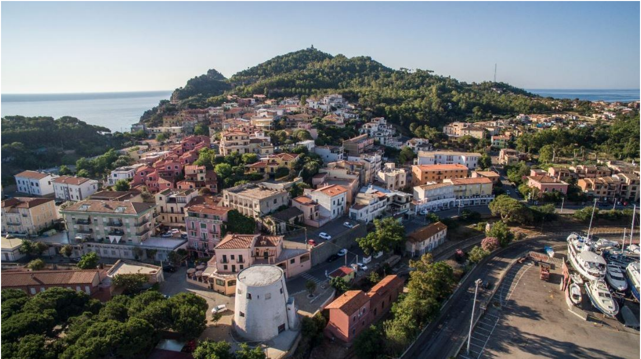
Fig. 2 - Al frente, la torre de San Miguel y, al fondo sobre la cima del promontorio, el faro de Bellavista.