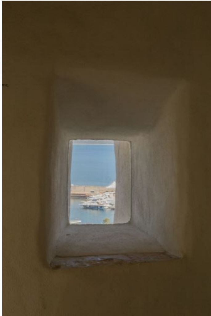
Fig. 6 - El puerto de Arbatax visto desde una aspillera de la torre (foto de Unicity S.p.A.).