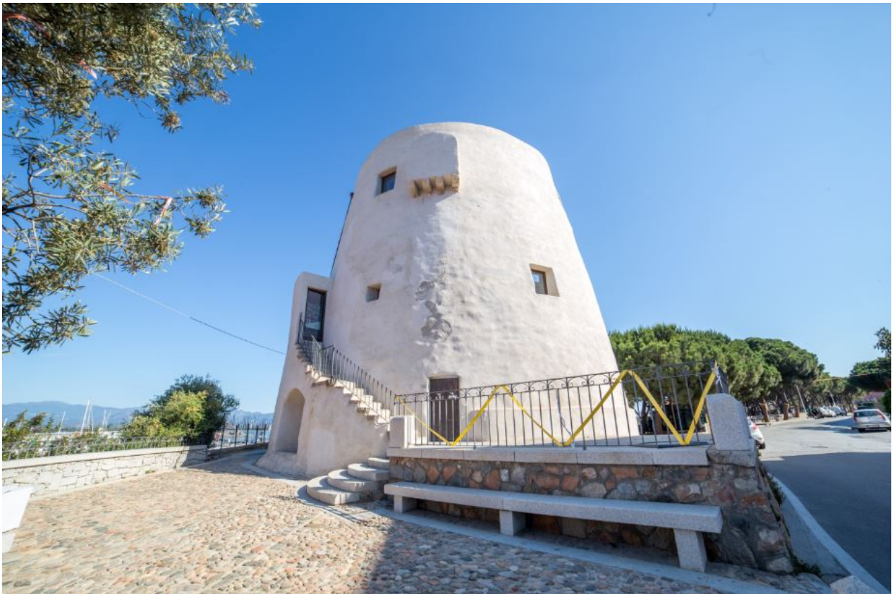
Fig. 4 - La torre de San Miguel.

En su interior contaba con varios niveles: la cisterna, el primer piso y la plaza de armas (terraza). El primer piso, con una bóveda de cúpula y sujetado mediante un pilar central, albergaba los espacios para los militares que presidiaban la torre y estaba en comunicación con la plaza de armas mediante una escalera interna de mampostería (fig. 5). Esta división se modificó en el siglo XIX cuando el edificio se convirtió en el cuartel de la Guardia di Finanza y, en la actualidad, la terraza está cubierta por una capa de hormigón.