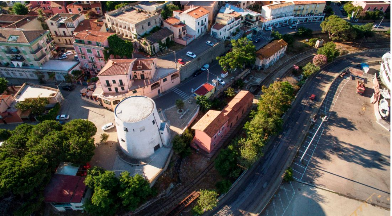
Fig. 3 - La torre de San Miguel vista desde lo alto.

Construida a mediados del siglo XVI, presenta una forma troncocónica (diámetro inferior a 15 metros, superior a 11 metros) y una poderosa estructura de muros formados por bloques de granito y pórfido, con una altura de 15 metros (fig. 4).