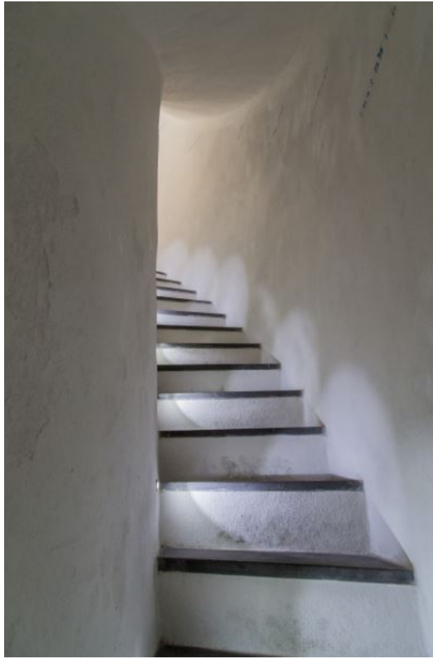
Fig. 5 - Las escaleras que llevan al piso superior de la torre.

La torre, cuya función era de guardia del puerto (fig. 6), estaba dotada de cañones y espingardas y, a lo largo de los siglos, fue objeto de numerosos ataques e intentos de desembarco. En 1846 cesó su función de avistaje y defensa y se convirtió en un cuartel. La torre, ya restaurada y con su antiguo esplendor, luce todavía las antiguas cañoneras (fig. 7). El acceso actual con una escalera de mampostería con una barandilla de hierro se realizó en el siglo XIX.