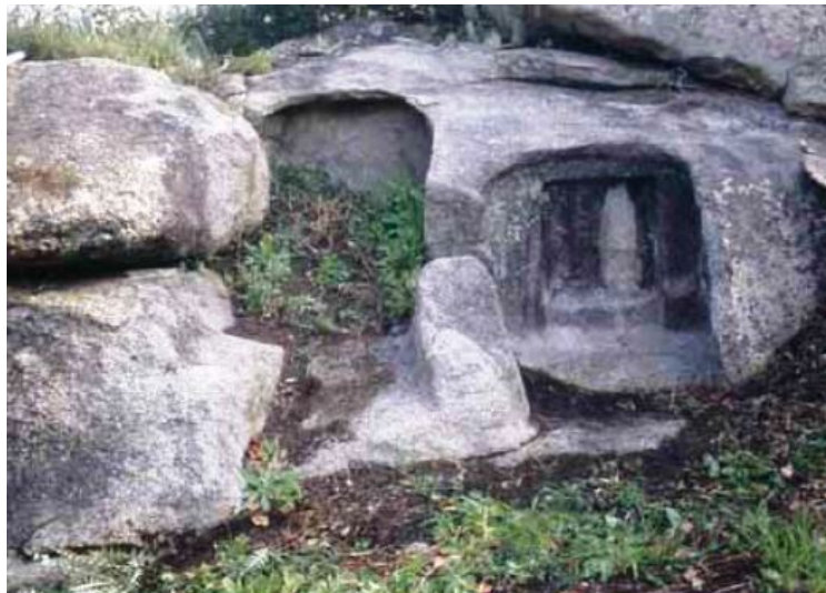
Fig. 4 - La necrópolis hipogéica de Monte Terli Las tumbas 4-5 (de FADDA 2012, pág. 18, fig. 17)

Los menhires estaban relacionados con las tumbas. Esta concentración de tumbas y de menhires que se halla en la colina de S'Ortali 'e su Monte, demuestra una vasta antropización del área y la presencia de elementos típicos de asentamientos neolíticos y de poblaciones que se dedicaban a la agricultura. En la mayoría de los casos, los megalitos de Monte Terli y de S'Ortali 'e su Monte indicaban la presencia de sepulturas.