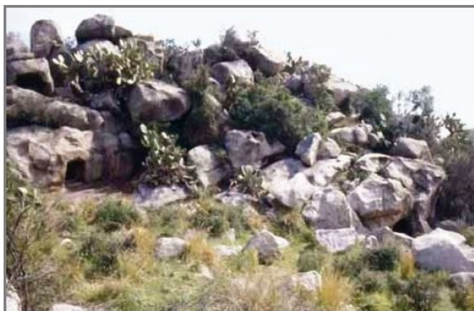
Fig. 1 - La necrópolis hipogéica de Monte Terli Las rocas aisladas donde están excavadas las domus de janas formadas por un solo ambiente (de FADDA 2012, pág. 13, fig. 12).

La necrópolis hipogéica de Monte Terli incluye 8 domus de janas: 4 en el interior de rocas aisladas en el lado oeste y 4 en una pared de difícil acceso (figs. 1-4).