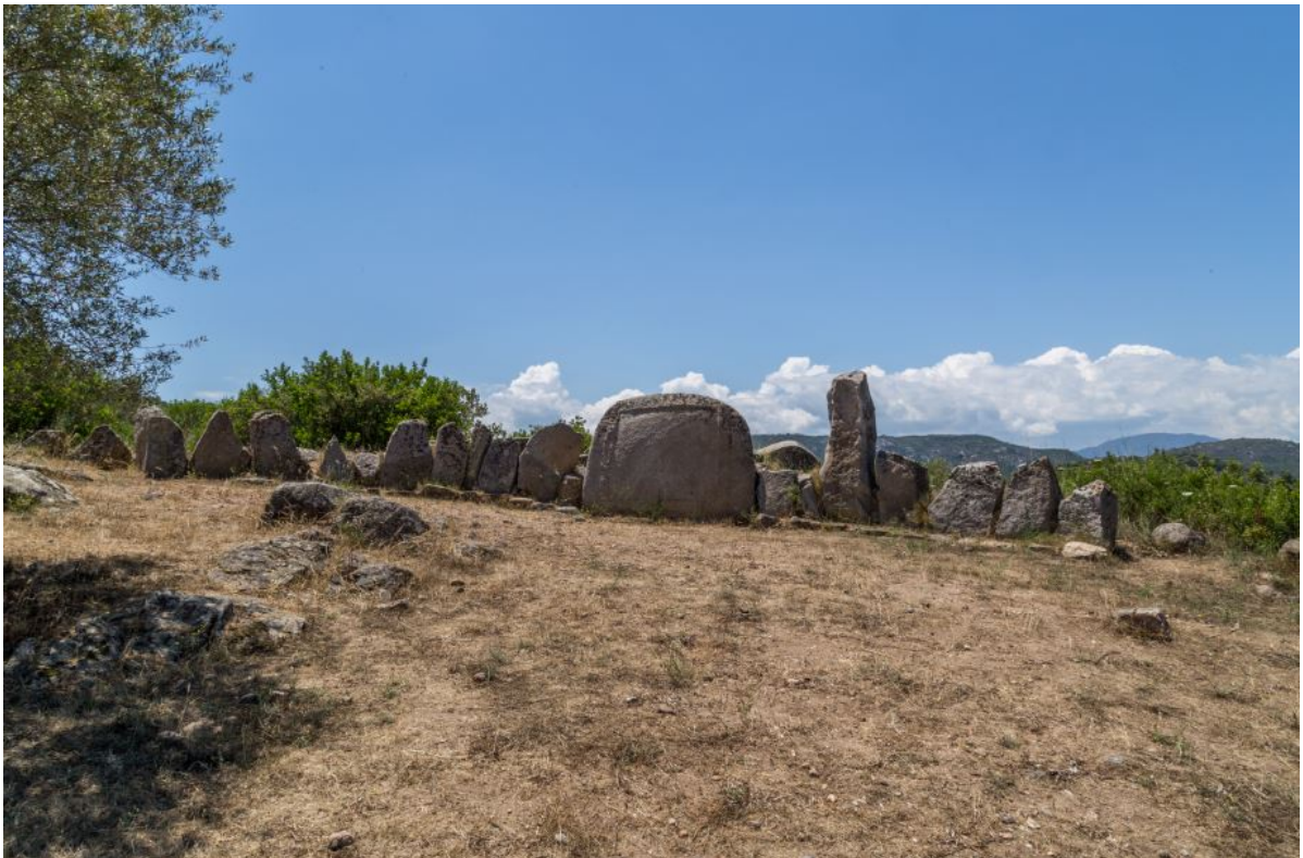
Fig. 2 - La exedra de la tumba de los gigantes de S'Ortali 'e su Monte.