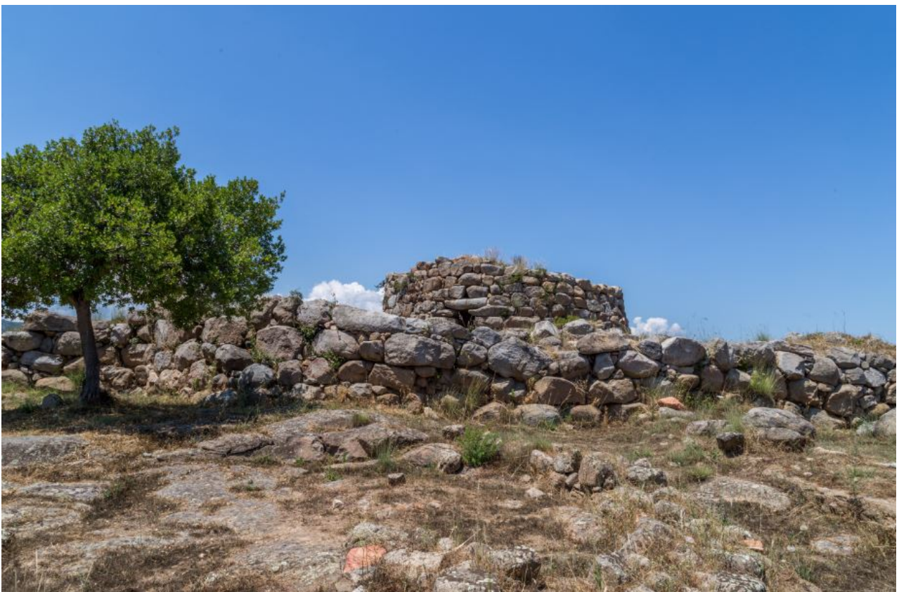
Fig. 1 - El nuraga de S'Ortali 'e su Monte.

El nuraga (fig. 1) está compuesto por una torre y está rodeado por un antemuro con tres torres. Se erige a 36 metros sobre el nivel del mar, en la parte más alta de la colina, y data de la Edad del Bronce Media (1500-1400 a.C.). En las zonas este, sur y suroeste del antemuro se abrían tres accesos.