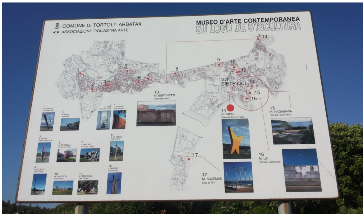
Fig. 1 - Panel ilustrativo con la ubicación de las esculturas.

A lo largo del recorrido se pueden admirar obras de Maria Lai (fig. 2), Giovanni Campus (fig. 3), Massimo Kaufmann (fig. 4), Mauro Staccioli (fig. 5), Antonio Levolella, Umberto Mariani (fig. 6), Ascanio Renda, Iginò Panzino, Alex Pinna (fig. 7), Hitetoski Nagasawa y G. Pardi (fig. 8).