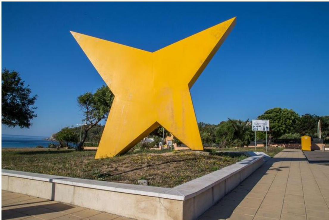
Fig. 8 - Piazzale Porto Frailis: obra de G. Pardi.