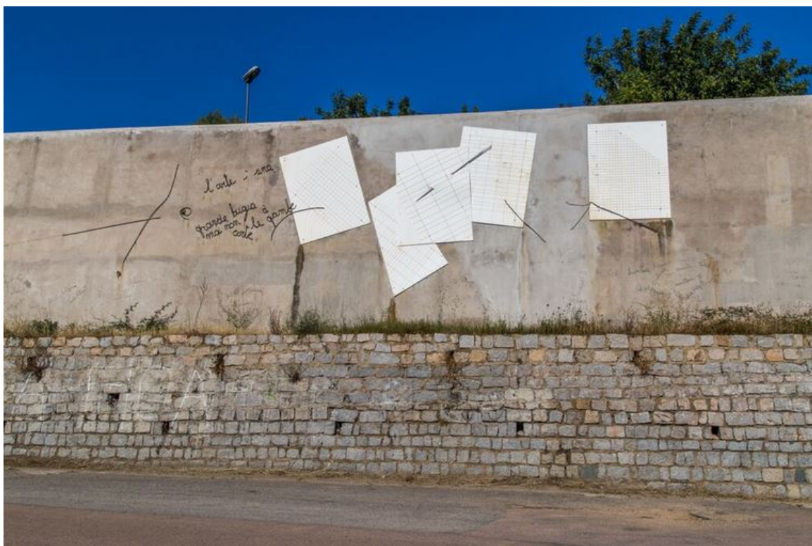
Fig. 2 - Calle San Gemiliano: Tempo dell'Arte , de Maria Lai.