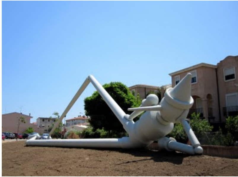
Fig. 7 - Calle Pirastu: Big Pinocchio , de Alex Pinna.