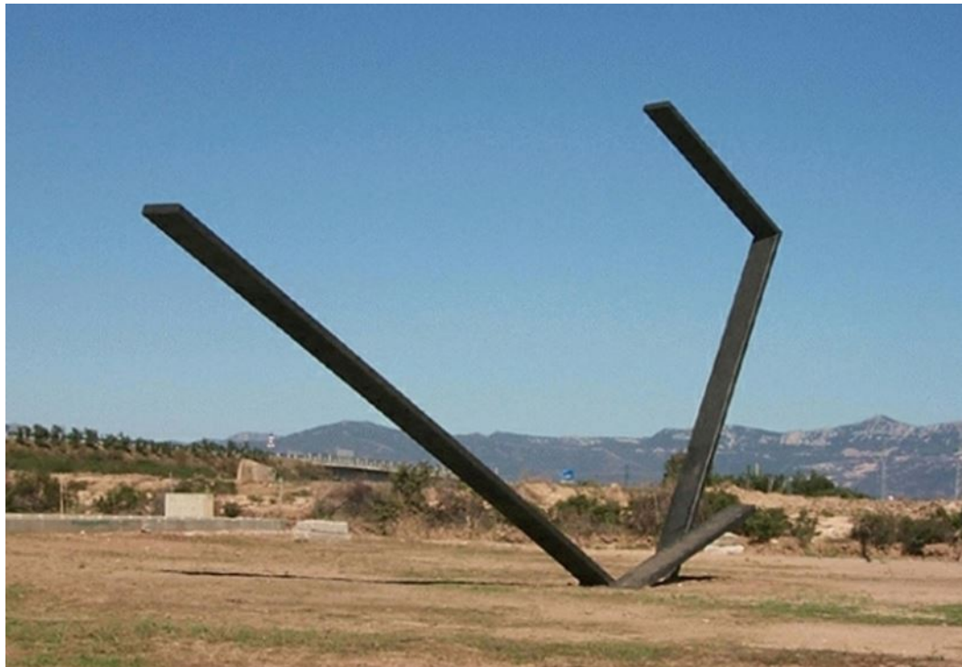
Fig. 3 - Localidad Monte Attu: Forma: rapporti e misure , de Giovanni Campus (de http://www.sardegнадigitalibrary.it/index.php?xsl=615&s=17&v=9&c=4461&id=57378 ).