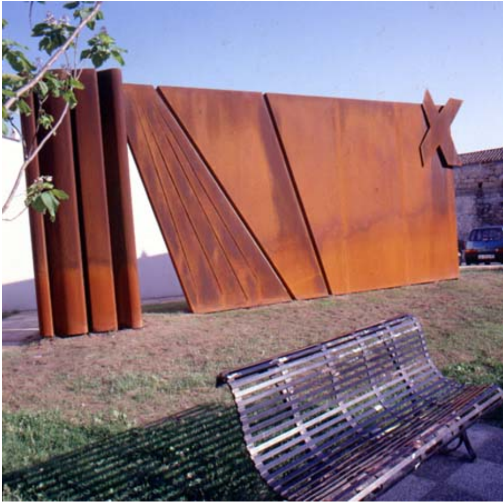
Fig. 6 - Plaza Racugno: Grande Sipario , de Umberto Mariani (de http://www.arte2000.net/Tortoli/home_ita.htm ).