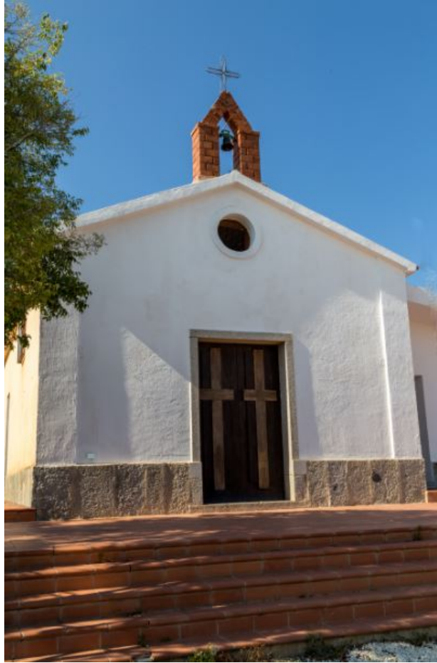
Fig. 3 - La fachada de la iglesia de San Gemiliano.

El interior, con una sola aula, presenta muros transversales sobre los que se abren arcos rebajados. El presbiterio se encuentra a una altura ligeramente elevada respecto al suelo de barro cocido. La pared de detrás del altar fue decorada en el 2009 con una estructura en traquita rosa, en la que esculpió en relieve la figura de San Gemiliano (fig. 4).