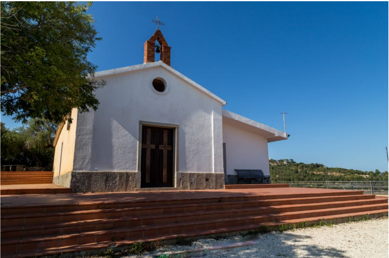
Fig. 1 - La iglesia de San Gemiliano.

El edificio religioso dedicado a San Gemiliano, en Arbatax, fue erecto sobre un promontorio, a 31 metros sobre el nivel del mar, cerca de la homónima torre costera. Para Cerdeña, este edificio representa un raro caso de iglesia campestre construida en las cercanías del mar (fig. 1).