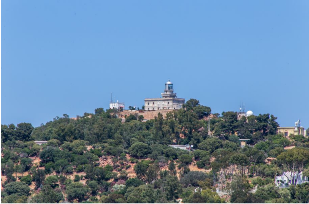
Fig. 10 - El faro de Capo Bellavista.