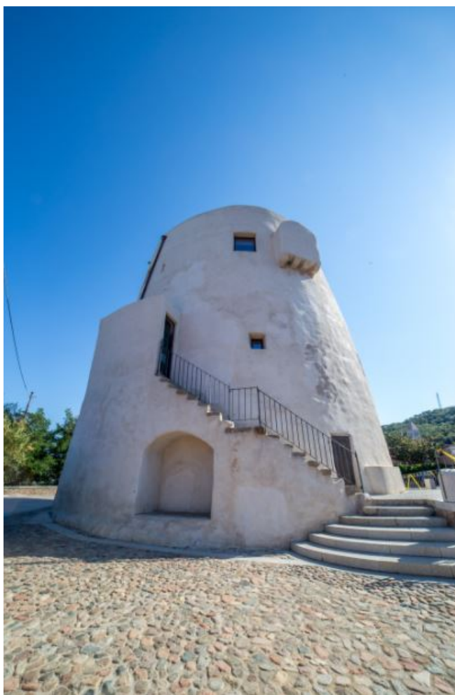
Fig. 8 - La torre de S. Miguel.

La torre de San Gemiliano, construida en 1587, en un origen se llamaba "Taratasciar" en árabe, es decir, la "decimotercera torre". En el siglo XVII la llamaron torre de Zacurru y hasta el año 1767 no la denominaron con su nombre actual. Se encuentra a 43 metros sobre el nivel del mar, sobre un pequeño promontorio que vigila la bahía de Porto Frailis, aproximadamente a 4 km de Tortolì. Desde el edificio se pueden avistar más de 25 km.ta a nord-est.