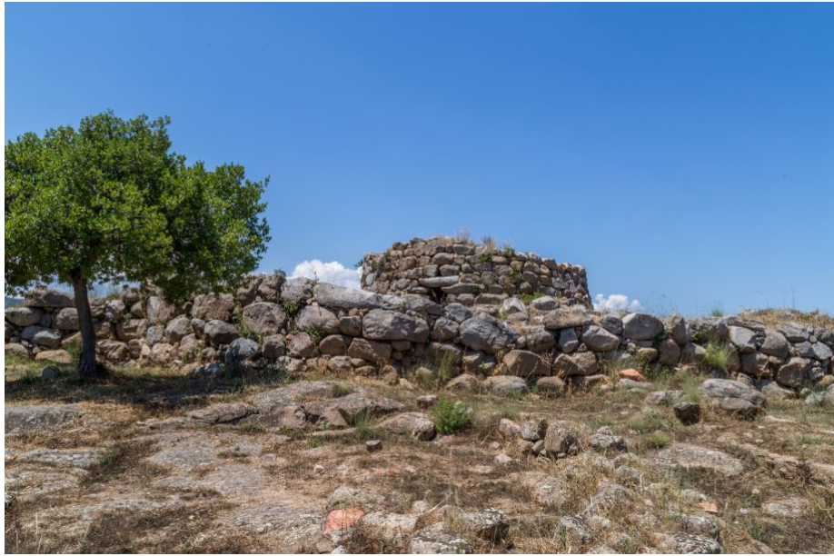
Fig. 4 - El nuraga de S'Ortali 'e su Monte.