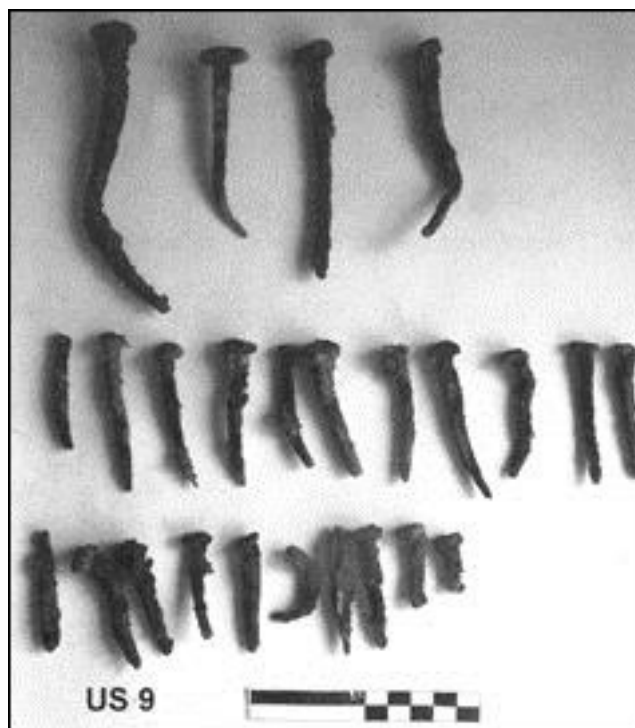
Fig. 1 - Tipos de clavos hallados durante las excavaciones.

Además de los restos de hierro, también se han encontrado objetos de bronce, en general cerraduras de cajas y baúles (fig. 3). También se han hallado otros objetos de bronce (lucernas; figs. 4 y 5), e hierro (además de los clavos, también la lama de un cuchillo), para los que se da una cronología general del siglo XIV. Se han encontrado objetos parecidos en contextos similares, como en el castillo de Monreale, Sardara (CA), aunque la mayoría son inéditos.