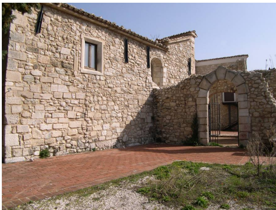
Fig. 1 - La puerta de entrada al monasterio de San Giorgio en Roccamorice, Pescara.

Las investigaciones llevadas a cabo en el yacimiento de Trullas en varias campañas de excavaciones arqueológicas en los años 2002, 2005 y 2006, han permitido definir la extensión y la posible organización de los espacios del monasterio adyacente a la iglesia de San Nicola. Sin embargo, según los estudios realizados y los restos de muros hallados, no ha surgido ningún dato que pueda indicar la presencia de un acceso directo al monasterio. Sin embargo, es improbable que la entrada al convento se realizara exclusivamente a través de la iglesia, dado que las operaciones para el transporte de las bebidas y lo necesario para la vida de los monjes habría causado varios inconvenientes. De hecho, en los asentamientos conventuales de tipo benedictino, donde los monjes vivían una vida de oración y trabajo, o incluso agrícola, era necesaria la presencia de despensas para conservar los alimentos. Según estas consideraciones, podría ser acertado hipotetizar la presencia de una puerta de servicio que permitiera acceder directamente a los almacenes del monasterio sin tener que pasar con sacos y otras mercancías voluminosas por el interior de una iglesia, no sólo de un tamaño pequeño, sino repleta de frescos.