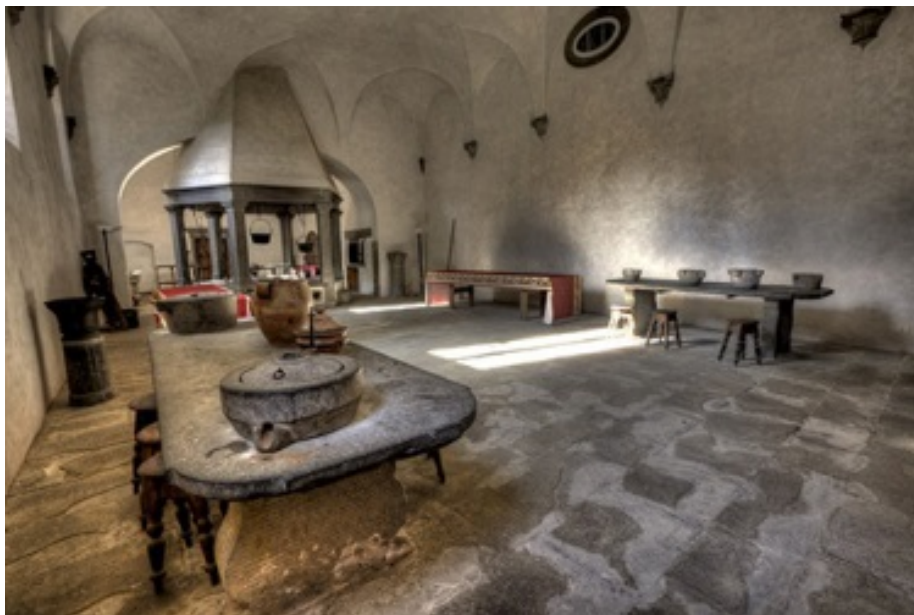
Fig. 1 - Cocina de Vallombrosa

Los monjes camaldulenses, según las normas benedictinas, se distinguen por su extraordinaria capacidad organizativa, por la importancia que le dan a la oración canónica, por la obligación de la residencia del monje en el monasterio y, sobre todo, por el reconocimiento de la importancia del trabajo tanto manual (agrícola) como intelectual (estudio, transcripción de códigos; figs. 1-5).