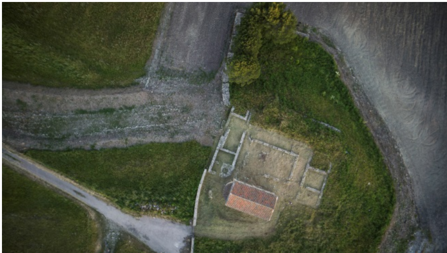
Fig. 3 - Vista aérea del complejo de San Nicola di Trullas.