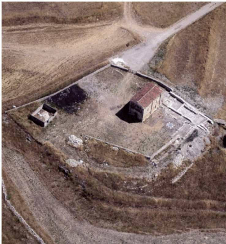
Fig. 1 - Vista aérea del complejo de San Nicola.

La iglesia de San Nicola di Trullas (fig. 1), construida en el siglo XII, se halla en el territorio de la localidad de Semestene (SS), aproximadamente a 50 km de Sassari.