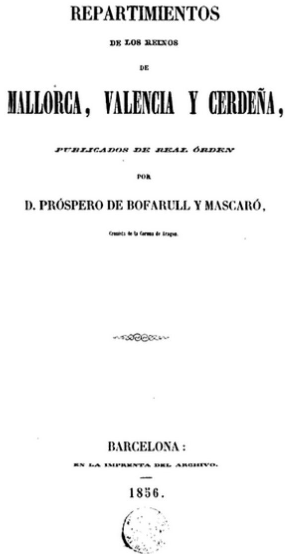
Fig. 3 - Portada de la edición del Repartimientos de los Reinos de Mallorca, Valencia y Cerdeña (de BOFARULL Y MASCARÒ 1856).

documentación sobre los reinos de Mallorca y Valencia, con el título más amplio del Repartimientos de los Reinos de Mallorca, Valencia y Cerdeña (fig. 3).