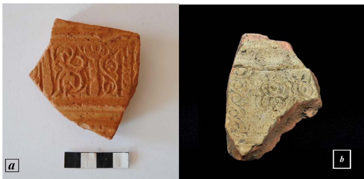
Fig. 1 - Luogosanto, Palazzo di Baldu : fragmentos de una tinaja islámica con una decoración impresa por molde (a. foto de F. Pinna; b. foto de Unicity S.p.A.).

Se trata de varios fragmentos de contenedores de alimentos, algunos de los cuales, pertenecientes a una tinaja, han sido hallados en un pozo del ambiente iota. Se caracterizan por decoraciones impresas sobre la arcilla cruda con motivos florales, geométricos o pseudoepigráficos colocados sobre registros superpuestos. La superficie externa es más clara y no tiene ningún revestimiento (fig. 1), mientras que otros ejemplares están cubiertos por una película que tiende al color celeste-turquesa (figs. 2-3).