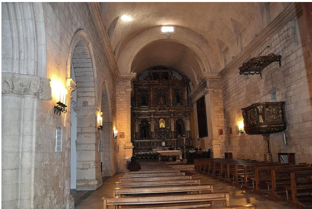
Fig. 4 - Sassari, iglesia de San Pedro de Silki: interior.

El 27 de enero de 1238, en el monasterio de San Pedro de Silki (fig. 4), Ubaldo Visconti redactó su testamento en el que expresó su voluntad de dejar su dominio en tierras de Gallura y sus derechos sobre Arborea a su primo Giovanni Visconti. Murió ese mismo año y, según la tradición, fue sepultado en la cripta de la basílica de Nuestra Señora de Luogosanto, donde yacía su madre.