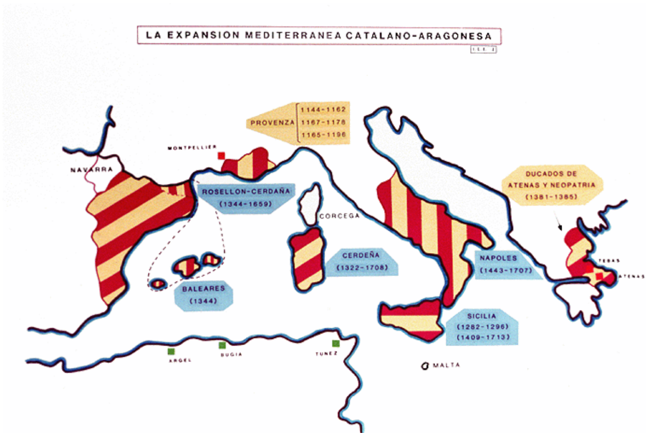
Fig. 1 - La expansión de la Corona de Aragón.

La aldea de Sent Steva, según la hipótesis relativa al Palazzo di Baldu , estaba activa cuando Cerdeña estaba ya bajo el dominio de los catalano-aragoneses. La localidad se menciona en un censo de las rentas que pagaban todas las aldeas de la isla de la Corona de Aragón (fig. 1), cuyo fin era saber la capacidad de contribución de todas las posesiones.