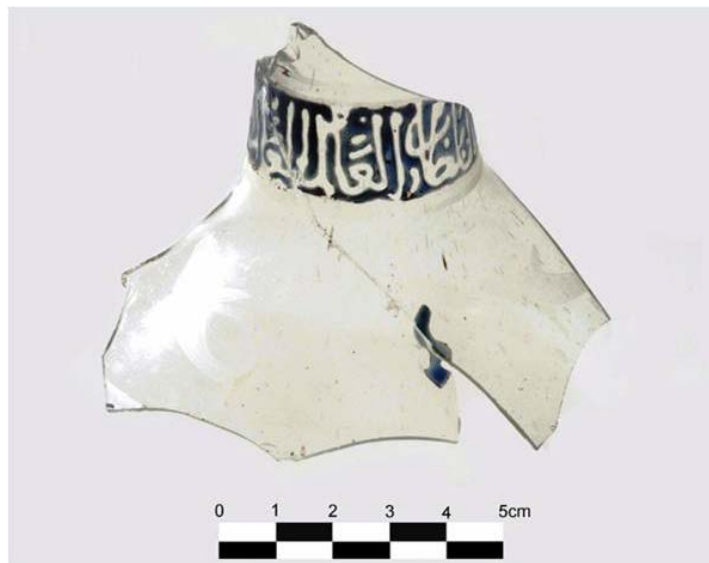
Fig. 1 - Fragmento de vidrio con una inscripción árabe pintada hallado en el Palazzo di Baldu.

La presencia de mercancía árabe en el complejo del Palacio de Baldu cuestiona las relaciones socioeconómicas entre el mundo islámico y Cerdeña, en un momento en el que el Mediterráneo era un lugar de grandes intercambios entre estados occidentales y orientales.