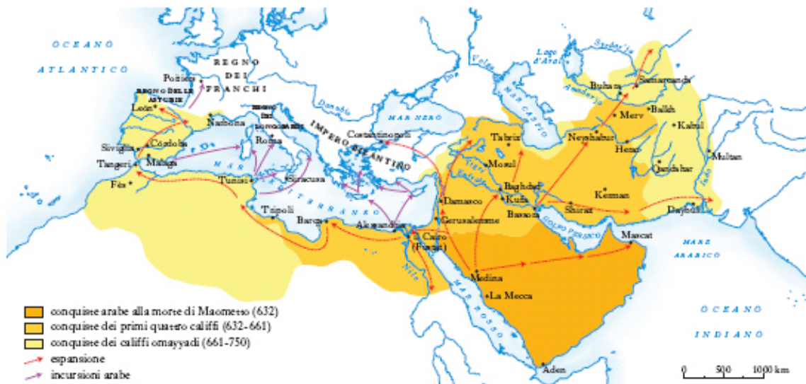
Fig. 2 - La expansión árabe.

Tras la conquista de las costas africanas a finales del siglo VII, Cerdeña, todavía en manos de los bizantinos, se convirtió en objeto de la expansión del islam.