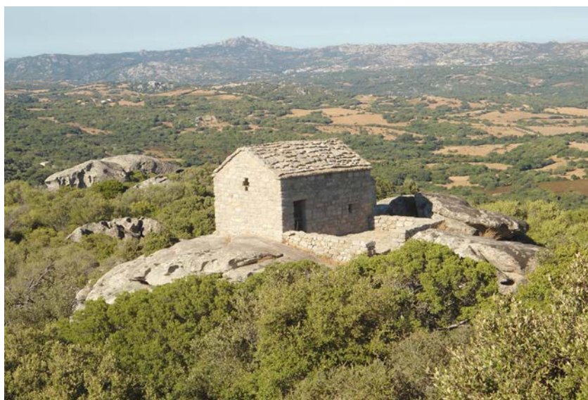
Fig. 2 - La iglesia de San Leonardo de Balaiana.

El aula de culto, conocida también como Santu Ninaldu , surgió en la cima de un área de granito que domina gran parte del territorio de Luogosanto (fig. 2). Está ubicada en la región de Balaiana, a la cual se llega a pie a través de un sendero empinado. Su arquitectura ha sido sometida a obras de restauración, y continuaron a usarla hasta el siglo pasado.