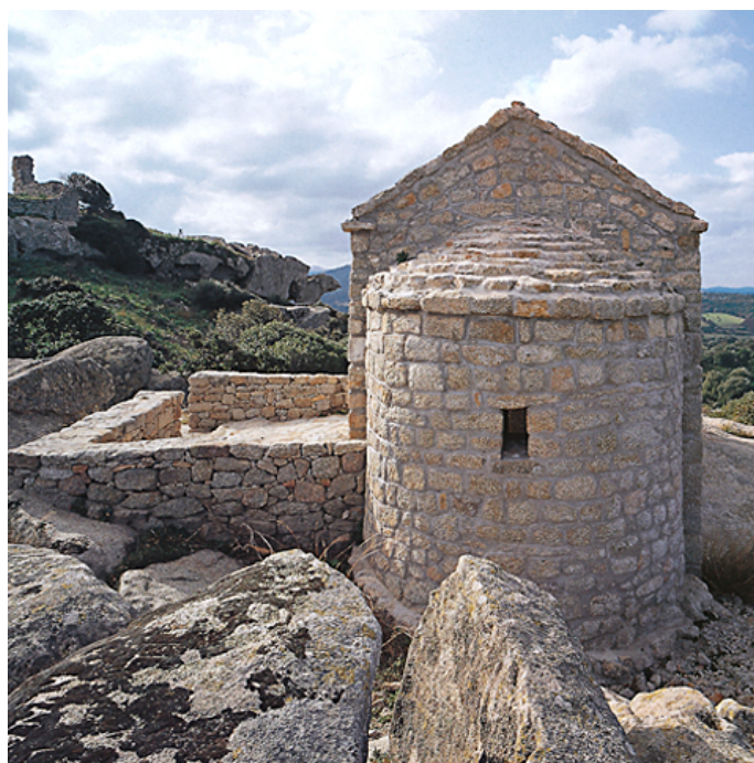
Fig. 4 - Iglesia de Leonardo, ábside: vista desde el este.

Su tamaño tan reducido ha llevado a pensar que la usaron para los talleres de las guarniciones del castillo y, según su forma, podría datar de la segunda mitad del siglo XII d.C. En Córcega también se han hallado estructuras similares, lo cual nos ha llevado a hipotetizar la presencia de artesanos especializados en el uso del granito durante el período románico.