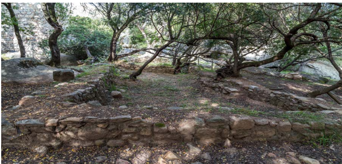
Fig. 3 - Palazzo di Baldu : ambiente \kappa , visto desde el oeste.