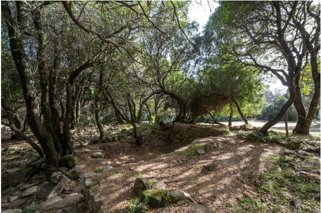
Fig. 2 - Ambiente alrededor del Palatzu di Baldu , visto desde el norte.

En el lado oeste de Lu Palatzu , cerca de la iglesia (fig. 3), se han hallado varios muros que han originado dos hipótesis: la primera indica que dichos muros podrían ser una prolongación de la aldea, más amplia respecto a los ambientes que conocemos; y la segunda identifica una aldea distinta del complejo. Supuestamente, este último estaba caracterizado por un palacio, alrededor del cual y en cuyo exterior se encontraba la aldea formada por viviendas, estructuras de artesanos y de subsistencia.