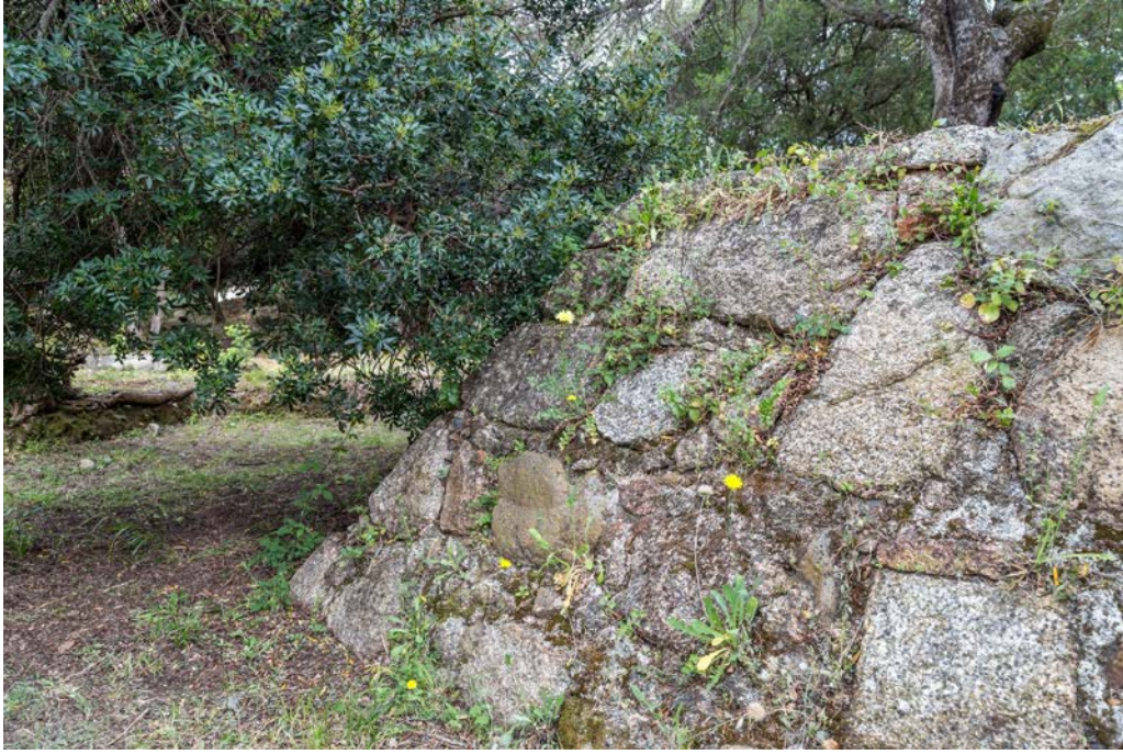
Fig. 5 - Luogosanto, Palazzo di Baldu: talud en la parte inferior de la torre.