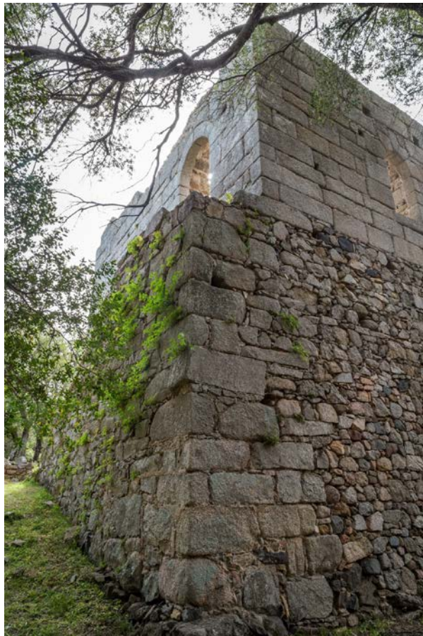
Fig. 1 - Luogosanto, Palazzo di Baldu: esquina entre el lado norte y el oeste.

La torre fue construida con una técnica diferente. Se nota una gran diferencia entre la parte inferior y la superior de la estructura (fig. 1).