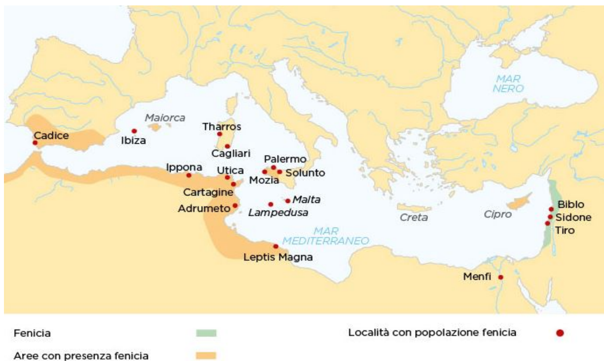
Fig. 3 - La colonización fenicia donde se indican las ciudades-estado en Fenicia y las principales localidades en expansión.

Estos últimos, muy probablemente procedentes de Córcega, pertenecen al grupo de los pueblos del área alta de la Gallura, que bloquearon la colonización fenicio-púnica (fig. 3) e hicieron difícil la romana.