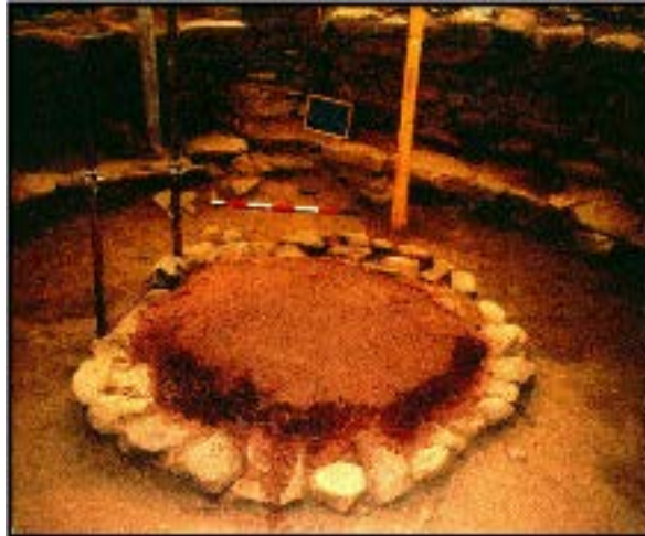
Fig. 3 - Aldea nurágica de M. Rujù, cabaña destinada a las reuniones.

La típica clase tumbal de dicha época es la tumba de los gigantes, que perteneció al territorio de Luogosanto, como los ejemplos de Montiggiu de Lu Paladinu en la localidad de Chivoni - Stazzo Pruncilvunu.