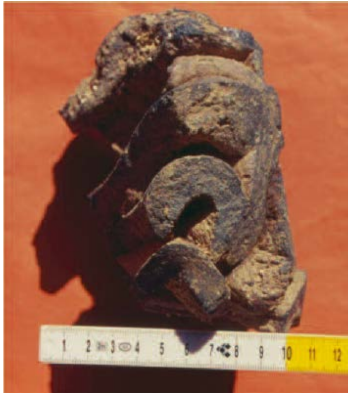
Fig. 10 - Palazzo di Baldu , material de terracota deformado y fundido durante la fase de cocción (de Pinna, Corda, en impresión, pág. 152 fig. 10).

A eso hay que añadirle el hallazgo de otros indicadores del desarrollo de actividades productivas en el área, como restos de vidrio, de trabajos y un elemento en granito con restos de vidrio. Muchos autores han relacionado la aldea de Sent Steve , de la que se tienen noticias desde el siglo XIV, con los ambientes de alrededor del patio, haciendo coincidir a la aldea con este complejo. Según los muros que podrían haber estado en el lado oeste de Lu Palatzu , han surgido dos hipótesis: la primera indica que los muros serían una prolongación de la aldea, más amplia respecto a los ambientes que ya se conocen; la segunda indicaría que la localidad no tuvo que ver con el complejo. Este último pudo haber sido un palacio, alrededor del cual y en cuyo exterior se encontraba la aldea con viviendas, estructuras artesanales y de subsistencia.