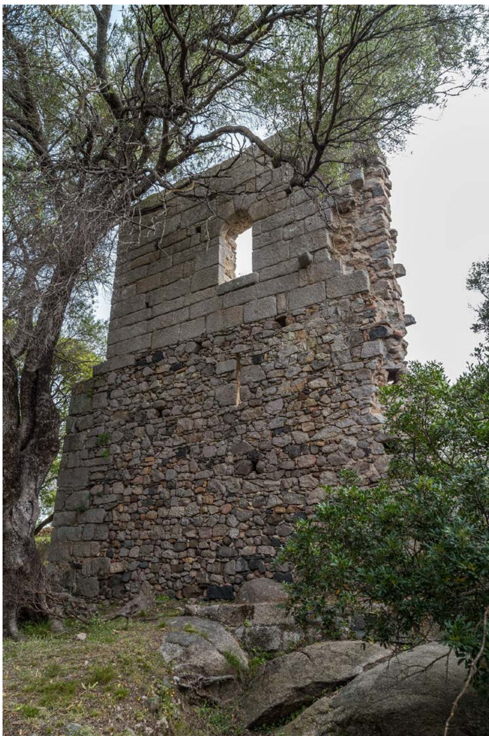
Fig. 3 - Palazzo di Baldu . vista desde el oeste.

Los tres niveles de la torre contaban con ventanas y una escalera externa (fig. 4) que daba acceso al área noble. El nivel inferior estaba dotado de un muro en talud en su exterior, mientras que en su interior contaba con un gran bloque de piedra.