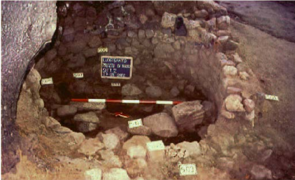
Fig. 9 - Luogosanto, localidad de Santu Stevanu . el horno durante las actividades de excavación (de Pinna, Corda, en impresión, pág. 150 fig. 8).

identificadas) y un horno (fig. 9) caracterizado por una estructura de planta circular, para la producción de material (fig. 10) y objetos de cerámica: el material figulino lo usaban para crear el techo del complejo (fig. 10).