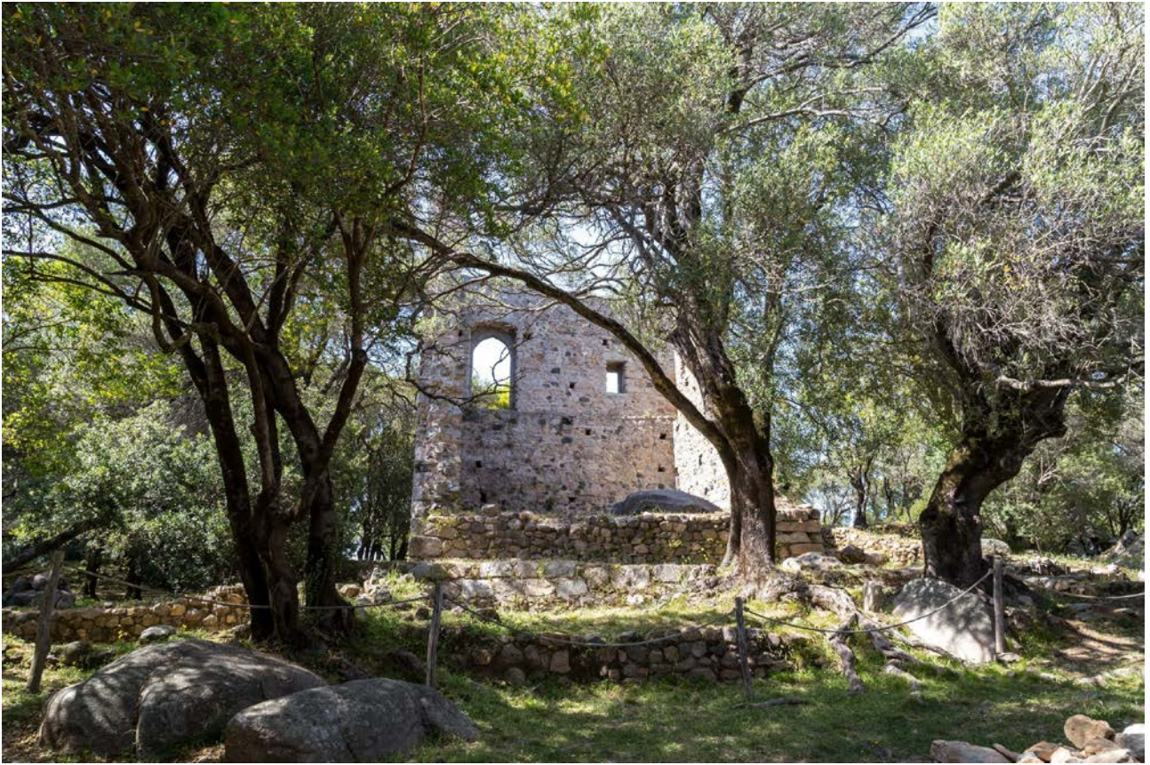
Fig. 2 - Palazzo di Baldu . vista desde el sureste.