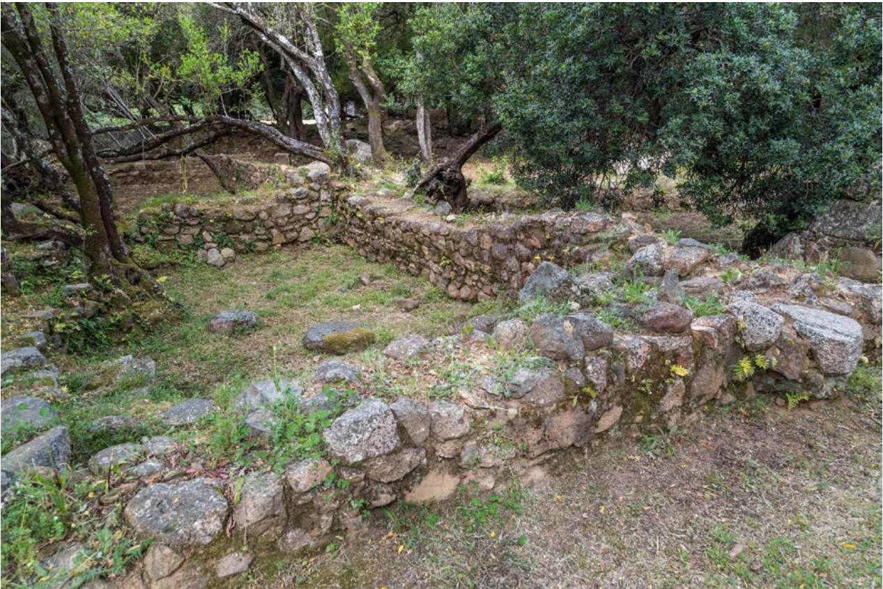
Fig. 5 - Palazzo di Baldu . ambientes \iota y \kappa , vistos desde el este.

Según los datos actuales de las investigaciones, los ambientes del complejo tienen usos diferentes, como residencial y artesanal como lo demuestran, por ejemplo, los numerosos objetos de metal que se han hallado en los espacios \beta (beta) y \gamma (gamma); pero también se han encontrado almacenes, cocinas, establos y talleres. Dichas actividades, junto con la peculiaridad de la torre, como la técnica de construcción y la amplitud de las aberturas, han llevado a identificar el asentamiento como un importante centro para la administración del territorio del juzgado de la Gallura, o incluso como la residencia de un personaje político o religioso, que desempeñaban un papel determinante en el control del reino.