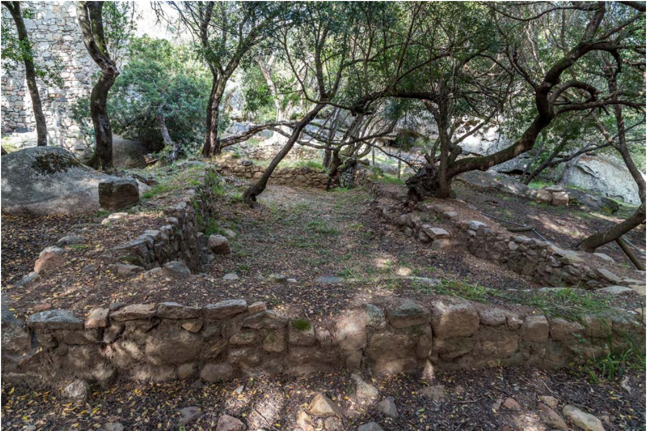
Fig. 6 - Palazzo di Baldu . ambiente κ, visto desde el oeste.

El palacio se encontraba en un área en la que se podían defender naturalmente tanto por la depresión del terreno que rodeaba el complejo, como por la presencia de laderas rocosas de granito caracterizadas por taffoni cuya altura, superior a los 10 m, protegía a la torre en dos de sus niveles del lado este y sureste: estos últimos podrían haber desempeñado la función de un sistema de fortificación.