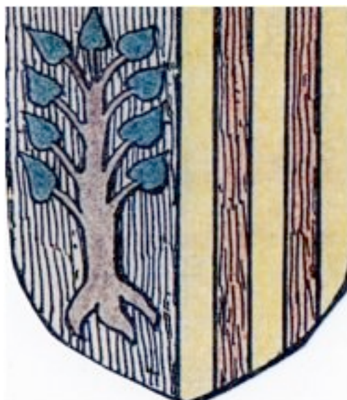
Fig. 4 - El escudo de armas del juzgado de Arborea: árbol de Arborea y franjas de Aragón (de http://upload.wikimedia.org/wikipedia/it/a/af/Stemma_giudicato_di_arborea.jpg ).

Este fragmento de vidrio podría atestiguar la presencia en Monreale de algunos miembros de la familia de los jueces de Arborea o de un miembro de la estirpe catalano-aragonesa, los cuales no eran los únicos en poder usar artículos con el escudo de la Corona, sino que también contaban con los medios económicos necesarios para poder encargar un producto de lujo como estos vasos, personalizados con la decoración deseada.