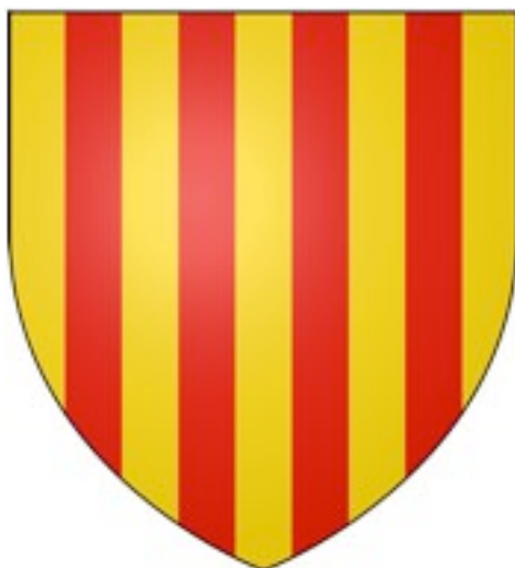
Fig. 3 - El escudo de la Corona de Aragón (de http://commons.wikimedia.org/wiki/File:Aragon_Arms.svg ).

Este fragmento de vidrio podría atestiguar la presencia en Monreale de algunos miembros de la familia de los jueces de Arborea o de un miembro de la estirpe catalano-aragonesa, los cuales no eran los únicos en poder usar artículos con el escudo de la Corona, sino que también contaban con los medios económicos necesarios para poder encargar un producto de lujo como estos vasos, personalizados con la decoración deseada.