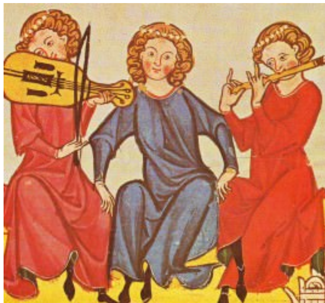
Fig. 3 - Miniatura con viola y flauta travesera, siglo XIV.