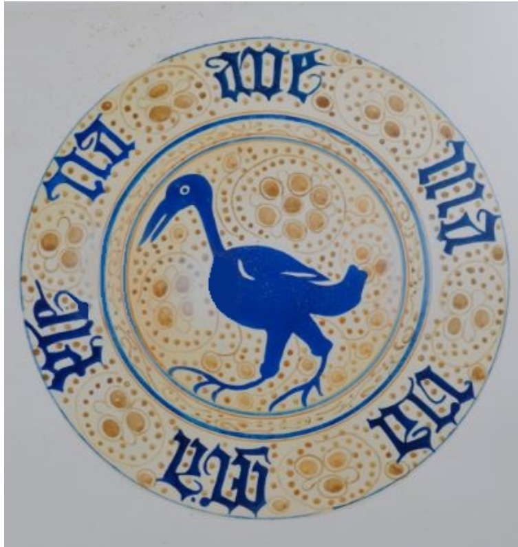
Fig. 2 - Ejemplar de plato de la "serie del Ave María", Manises (de Ravanelli Guidotti 1992, foto 37, pág. 68, ficha 37).

Para la parte epigráfica siempre usaban letras góticas pintadas en color azul, mientras que el fondo lo revestían con un reflejo azul metálico que, en algunas ocasiones, se realizaba en colores más cálidos. De hecho, para ahorrar en la producción, aumentaban la cantidad de óxido de cobre y reducían el de plata. El fragmento de cuenco hallado en Monreale cuenta, en la superficie interior, con un motivo decorativo de una rama con tres tallos que terminan con elementos vegetales en color azul y con reflejos. Por encima hay una línea azul que también incluye las letras "VE", que invocan a la Virgen. La superficie externa está decorada con puntitos, espirales y asteriscos.