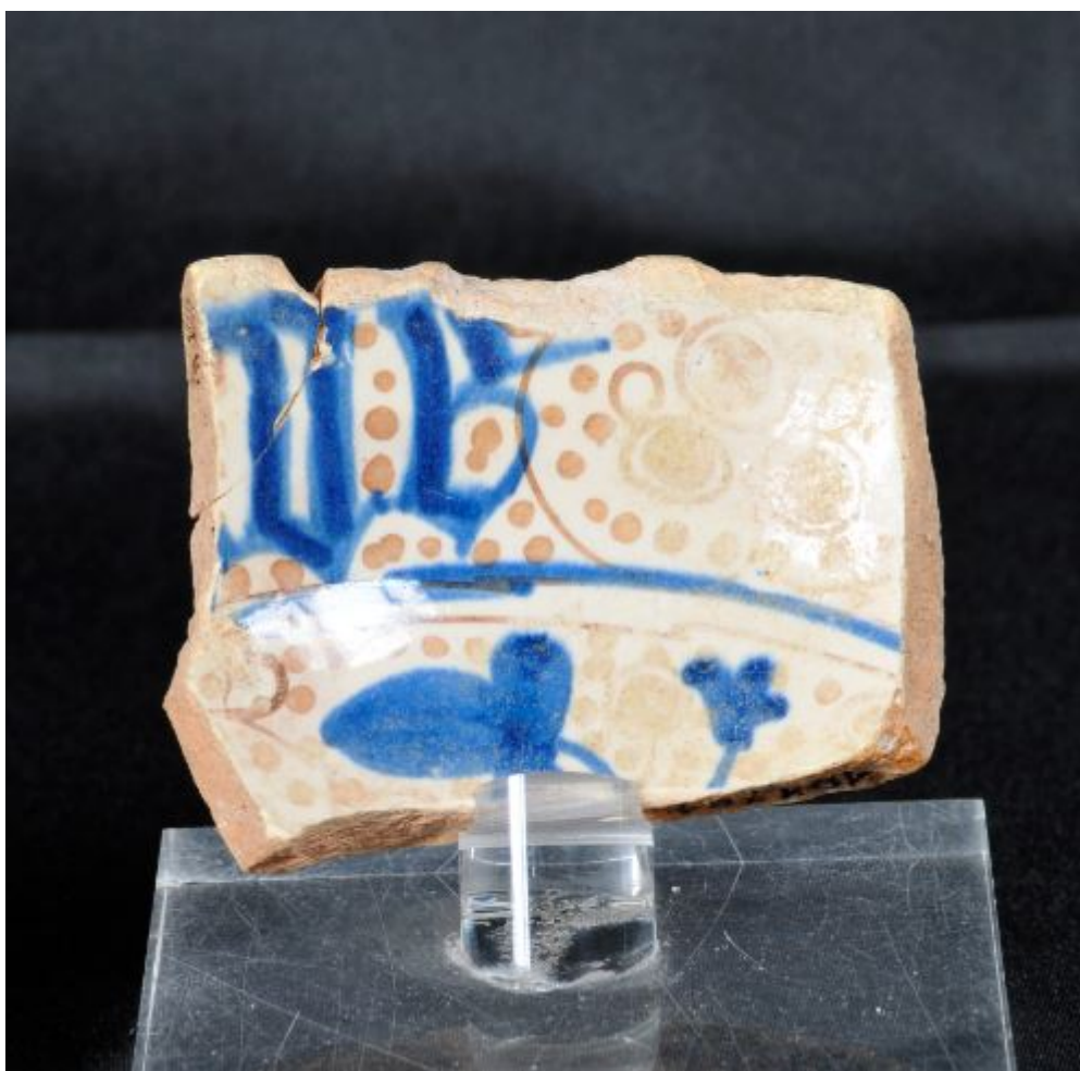
Fig. 1 - Fragmento de cuenco con las letras "VE" del castillo de Monreale (foto de Unicity).

Durante las investigaciones arqueológicas de 1992, dentro del "contenedor de basura" del castillo de Monreale, hallaron, junto con otros restos de cerámica, un fragmento de un cuenco hemisférico en mayólica de Valencia, decorado en color azul y con reflejos, que se podría adjudicar a la "serie del Ave María" (fig. 1).