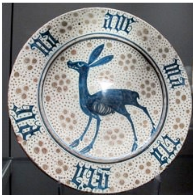
Fig. 3 - Ejemplar de palangana de la "serie del Ave María", Manises ( http://commons.wikimedia.org/wiki/File:Manises,_bacile_con_cerbiatto_e_iscrizione_ave_maria_gratia_plena,_1400-1450_ca..JPG ).