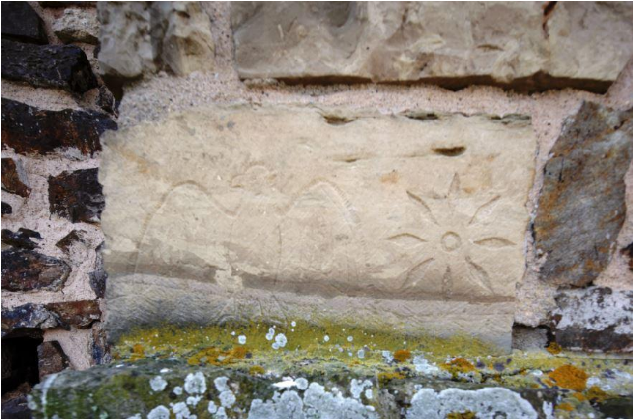
Fig. 4 - Bloque con elementos decorativos introducido en el muro del torreón.