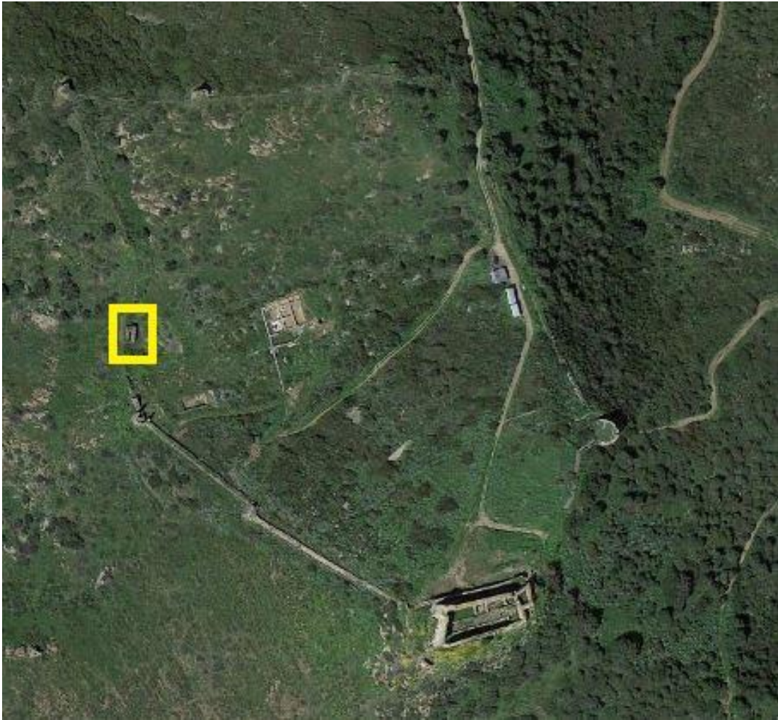
Fig. 2 - El complejo fortificado de Monreale donde resalta la ubicación de la estructura conocida como Su Zubu (reelaborado por M.G. Arru, de Google Earth).