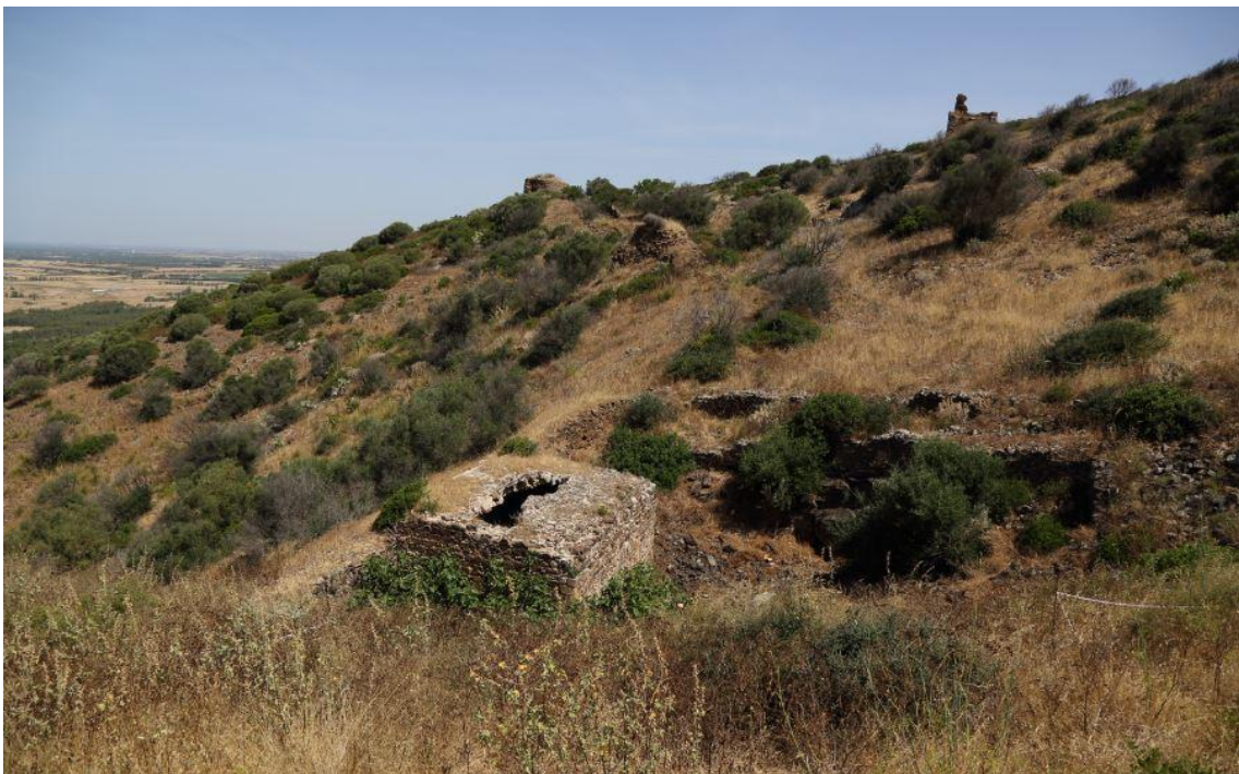
Fig. 4 - Su zubu.