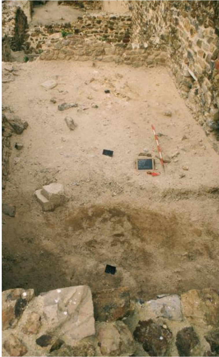
Fig. 4 - El ambiente theta visto desde el este.