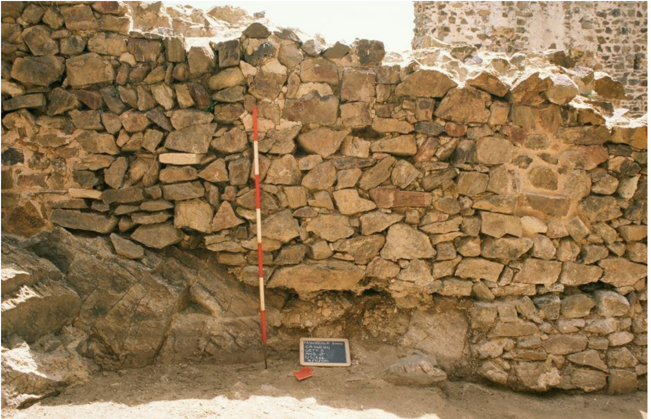
Fig. 5 - El ambiente theta visto desde el este.