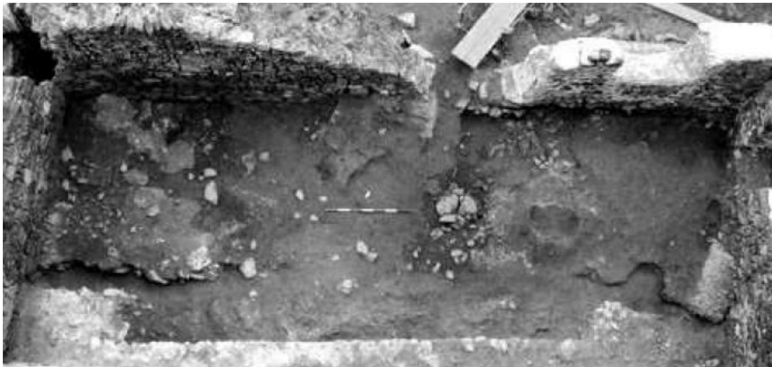
Fig. 3 - El ambiente kappa (de STASOLLA 2010, pág. 46).