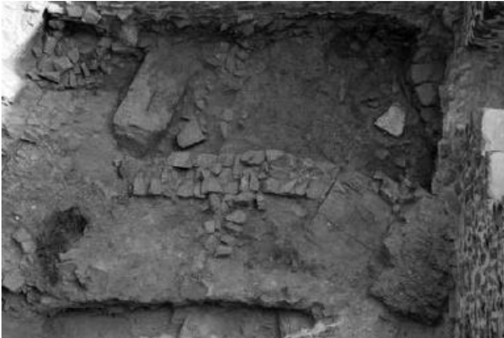
Fig. 5 - Ambiente kappa : estructuras de la posible instalación para la elaboración del hierro (de STASOLLA 2010, pág. 48).