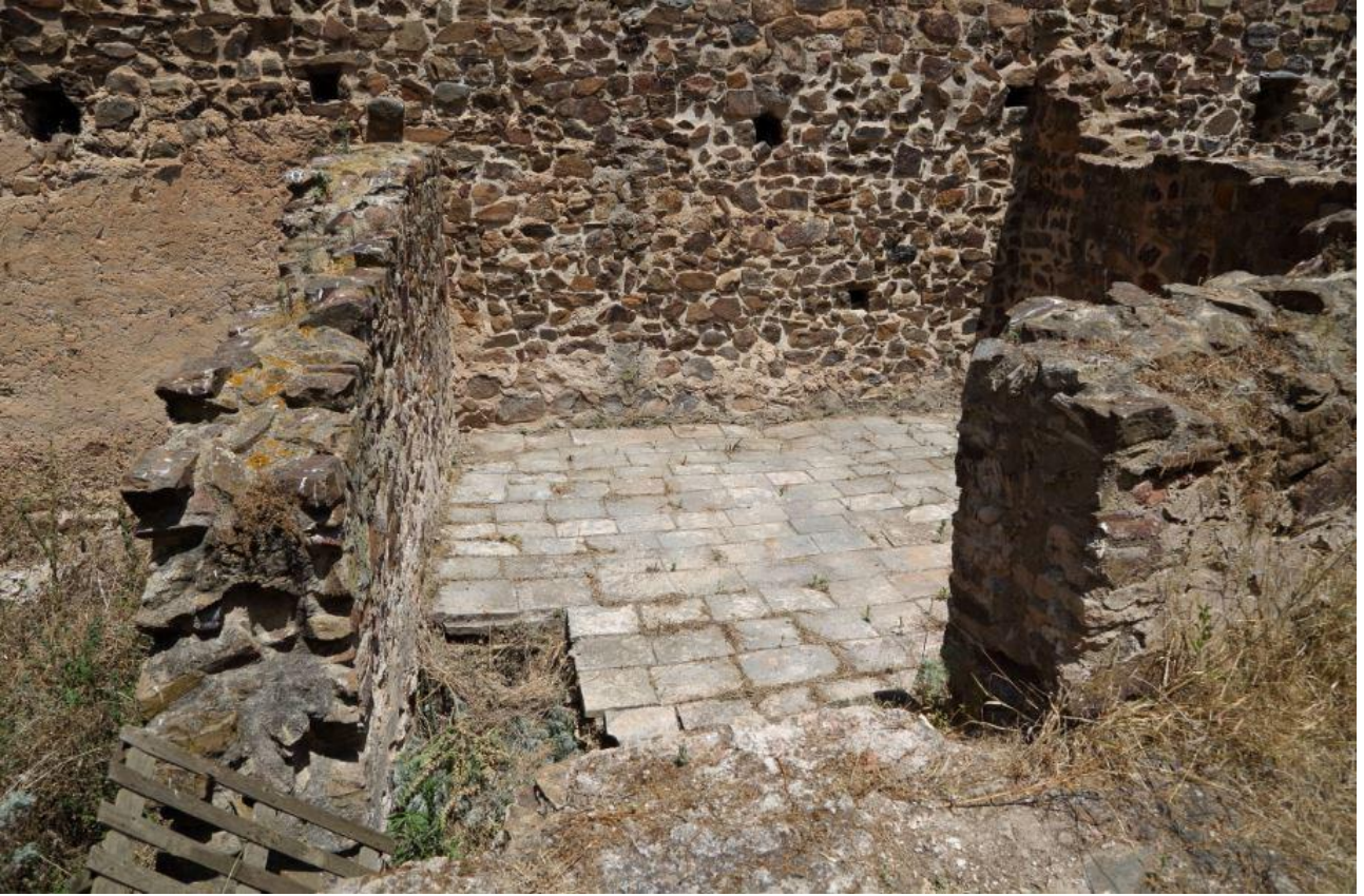
Fig. 4 - El ambiente iota y su suelo.