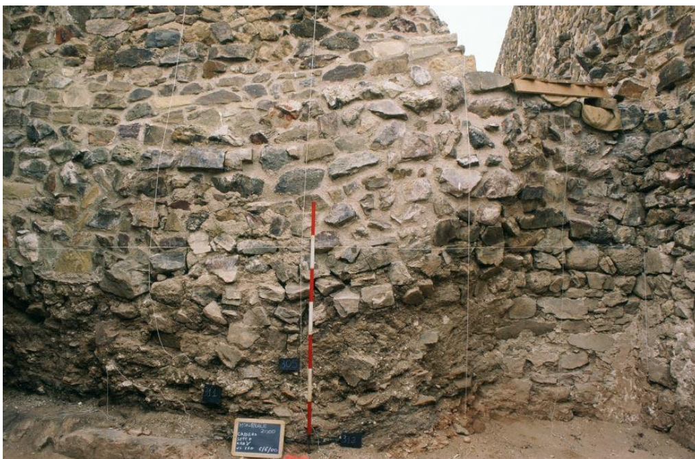
Fig. 4 - Interior del ambiente gamma (reelaborado por M. G. Arru).