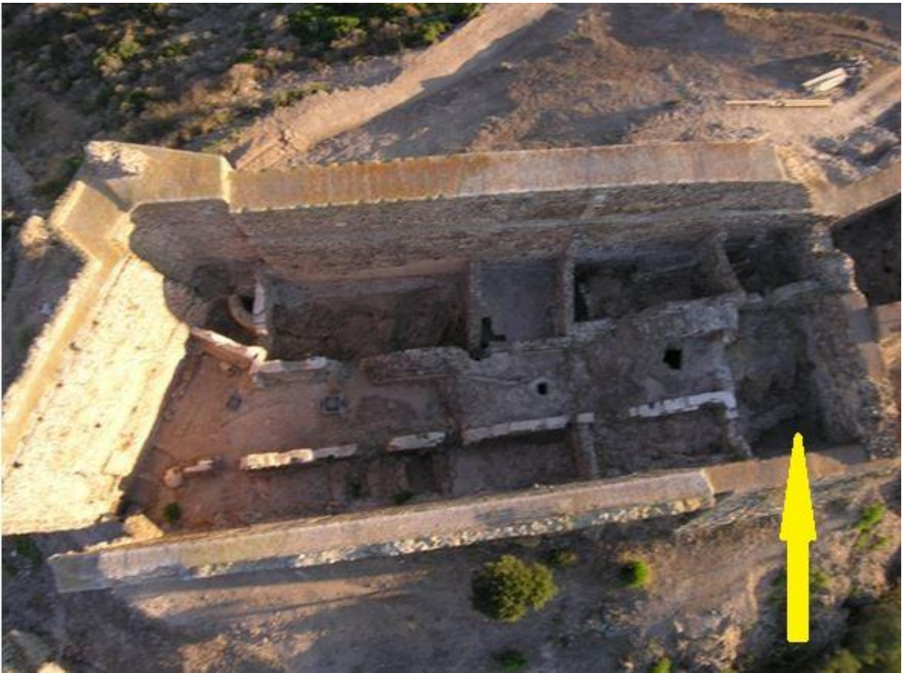
Fig. 2 - El torreón visto desde lo alto donde se ha resaltado el ambiente epsilon (reelaborado por M. G. Arru).