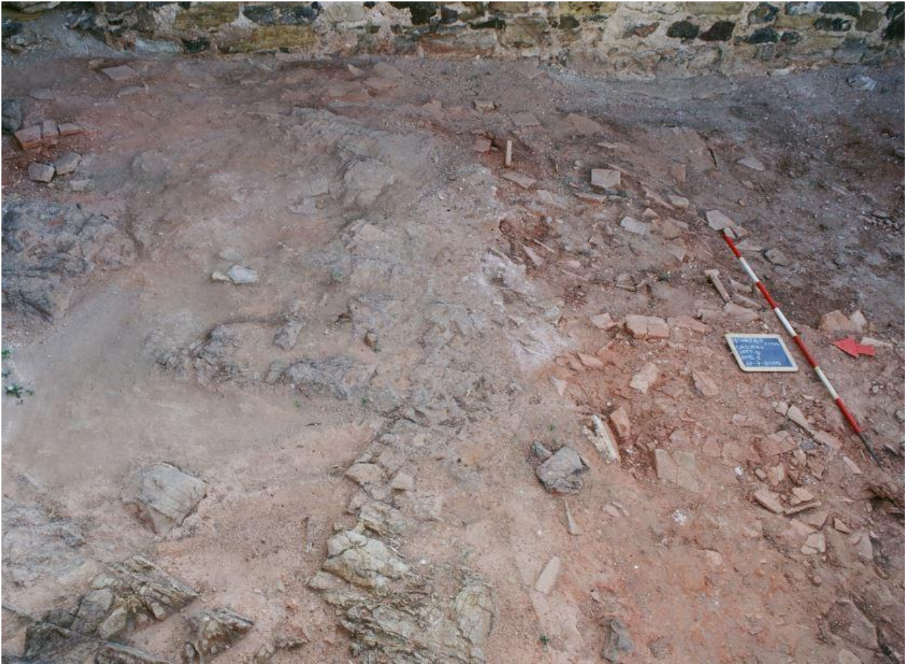
Fig. 3 - Detalle de la superficie rocosa del interior del espacio epsilon.