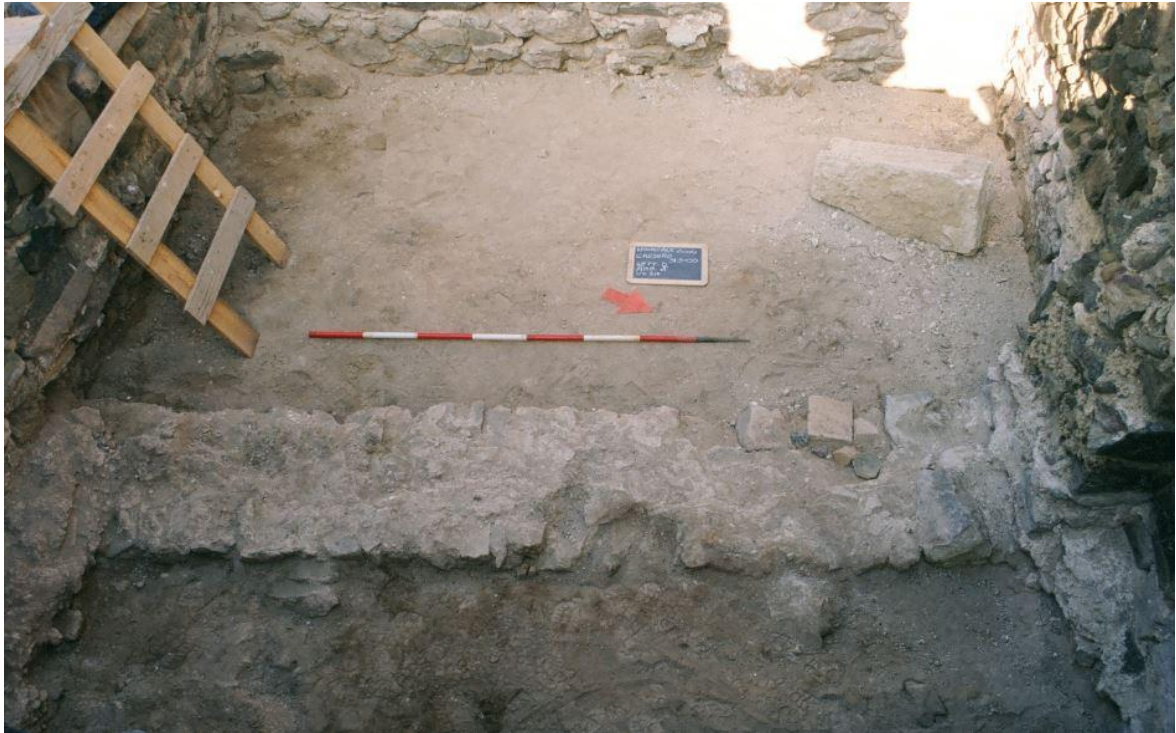
Fig. 3 - El ambiente delta visto desde el este.