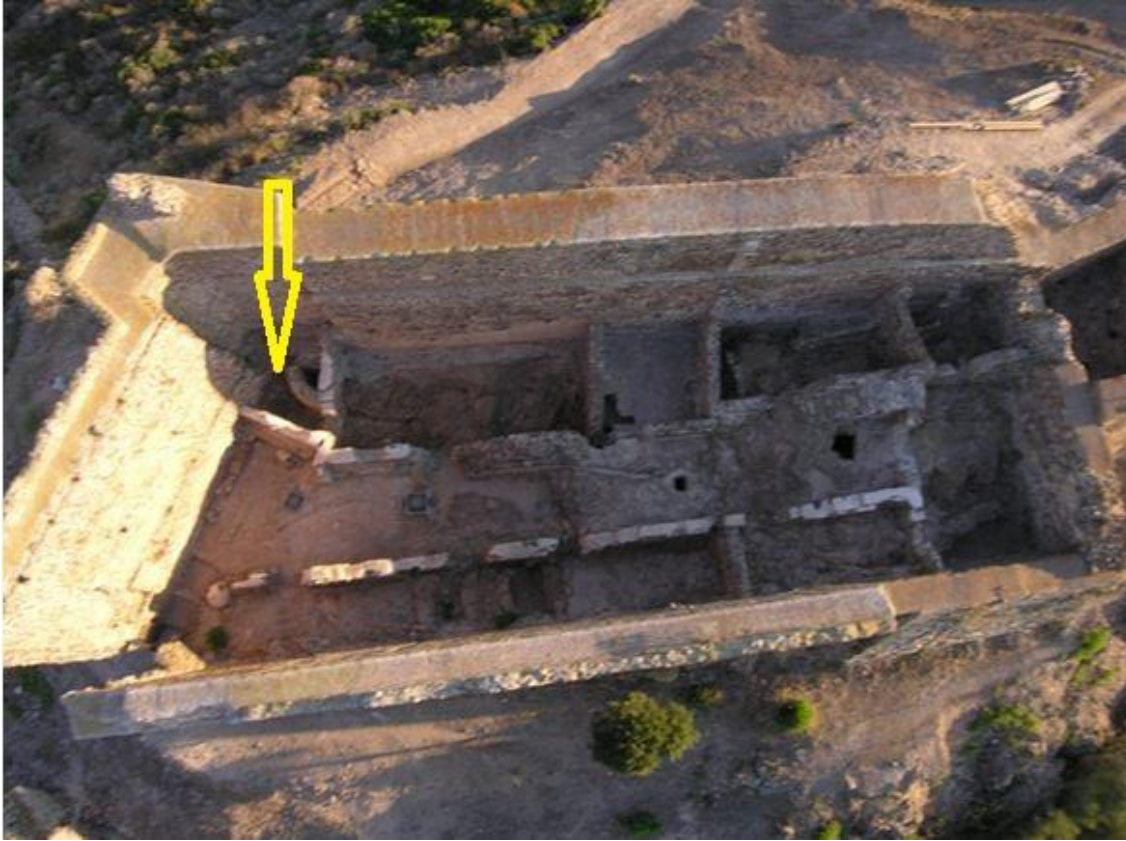
Fig. 2 - El torreón visto desde lo alto donde se ha resaltado el ambiente alpha (reelaborado por M. G. Arru, foto de R. Bordicchia).