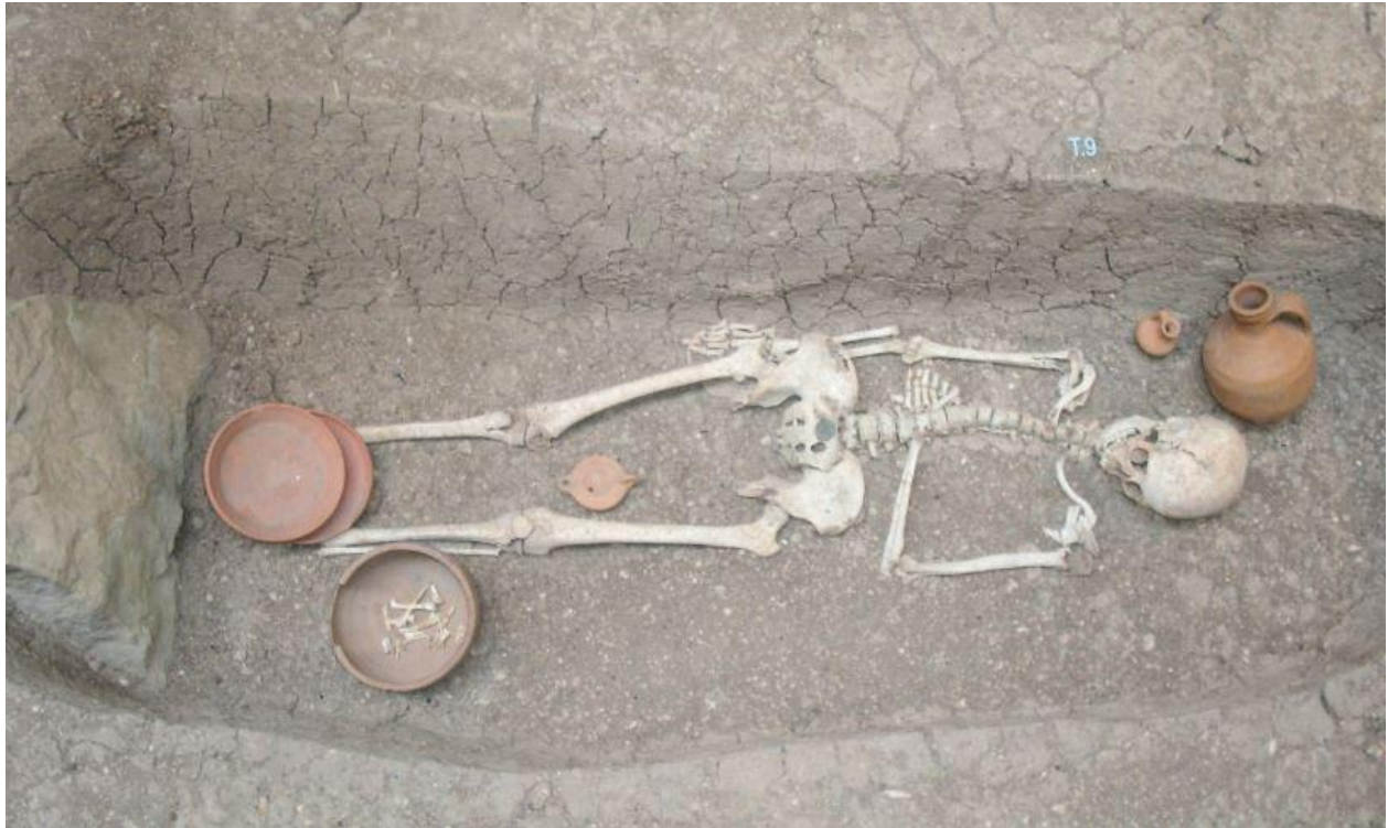
Fig. 3 - Reconstrucción de una de las tumbas de la necrópolis de Terr'e Cresia.