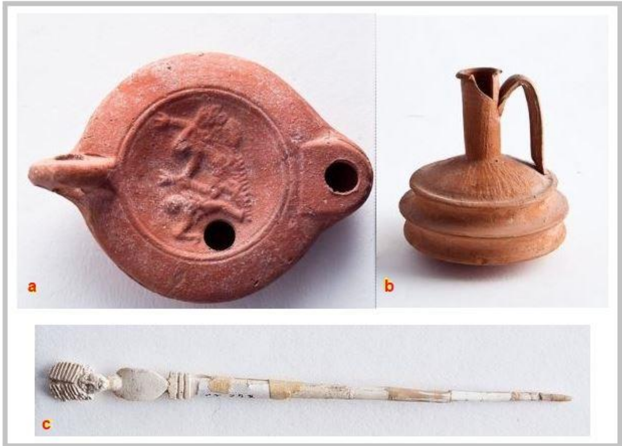
Fig. 2 - Restos de la Era romana procedentes del territorio de Sardara: a) candil; b) jarra; c) aguja para el pelo de hueso.

La necrópolis de Terr'e Cresia se descubrió en 1986 y se investigó en numerosas ocasiones hasta el año 1999. Las tumbas halladas, alrededor de cien, pertenecen al tipo de tumba de fosa y se han encontrado cubiertas por losas líticas pesadas. Además, también se han hallado sepulturas de inhumaciones e incluso de incineraciones que se han podido datar, gracias a las indicaciones de los ajuares fúnebres, en un arco cronológico entre el siglo I a.C. y el siglo III d.C. (fig. 3) 5 .