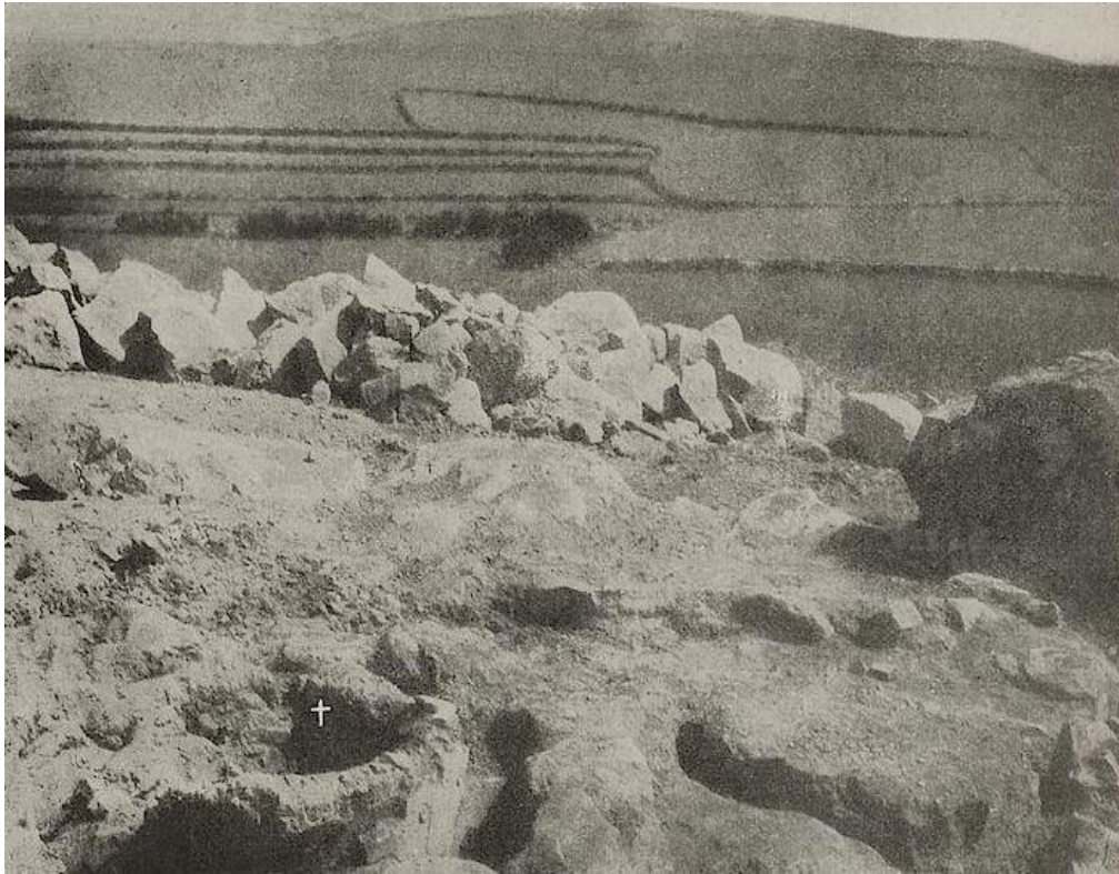
Fig. 1 - La estructura troncocónica que interpretó A. Taramelli como restos de un horno de fundición (de Taramelli 1918, col. 111-112, fig. 112).

En el momento de su hallazgo, en 1913, el arqueólogo Antonio Taramelli lo interpretó como un sistema de fusión de metales (fig. 1-2) 3 , mientras que entre 1975 y 1978, las excavaciones dirigidas por Miriam S. Balmuth permitieron compararlo con los "tabuns" del norte de África con impresiones digitales (fig. 3) 4 .