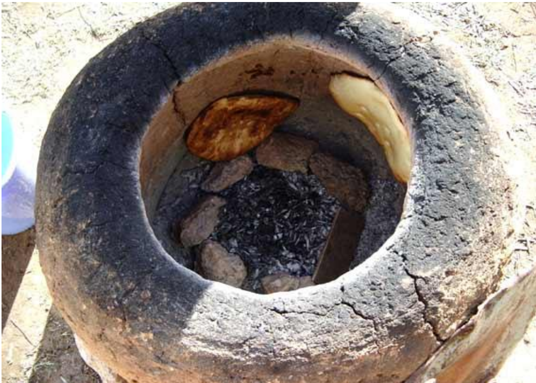
Fig. 3 - Un ejemplar de horno tabouna.