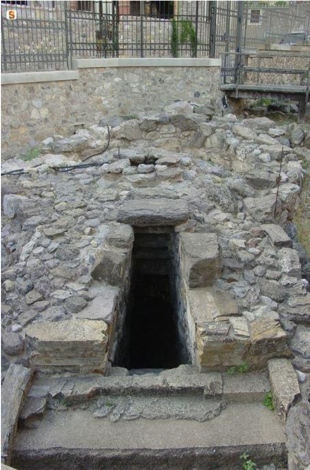
Fig. 3 - El pozo sagrado de Sant'Anastasia.