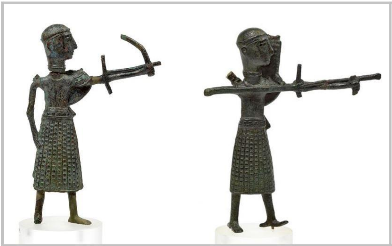
Fig. 2 - Las estatuas de bronce de los arqueros halladas en el enclave de Sa Costa.

Incluso el enclave de Sa Costa , hoy en día ocupado parcialmente por el edificio que alberga el Museo arqueológico de Sardara, ha entregado numerosas estructuras de la época nurágica y, en particular, una tumba que en 1912 excavó Antonio Taramelli, cuyo ajuar funerario estaba formado por dos estatuas de bronce de arqueros con un casco hemisférico y un delantal de coraza que cubre una corta túnica (fig. 2) 3 .