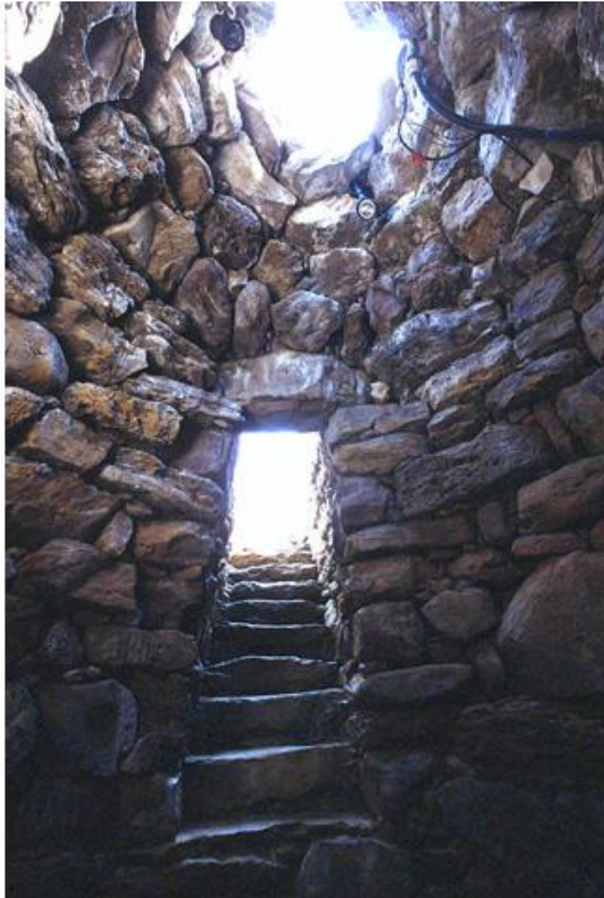
Fig. 4 - El interior del pozo sagrado de Sant'Anastasia.