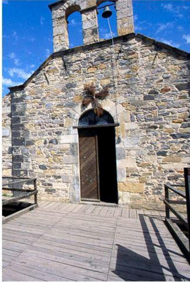
Fig. 5 – La iglesia de Sant'Anastasia en el lugar del pozo nurágico sagrado.