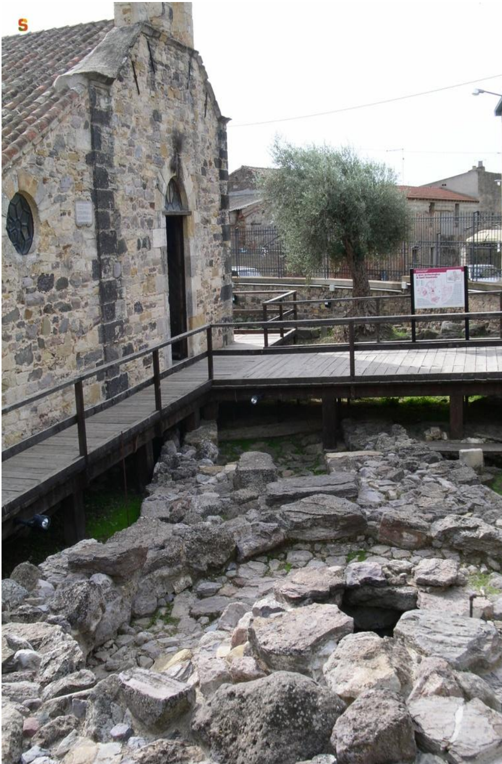
Fig. 6 – La iglesia y el pozo sagrado de S. Anastasia.