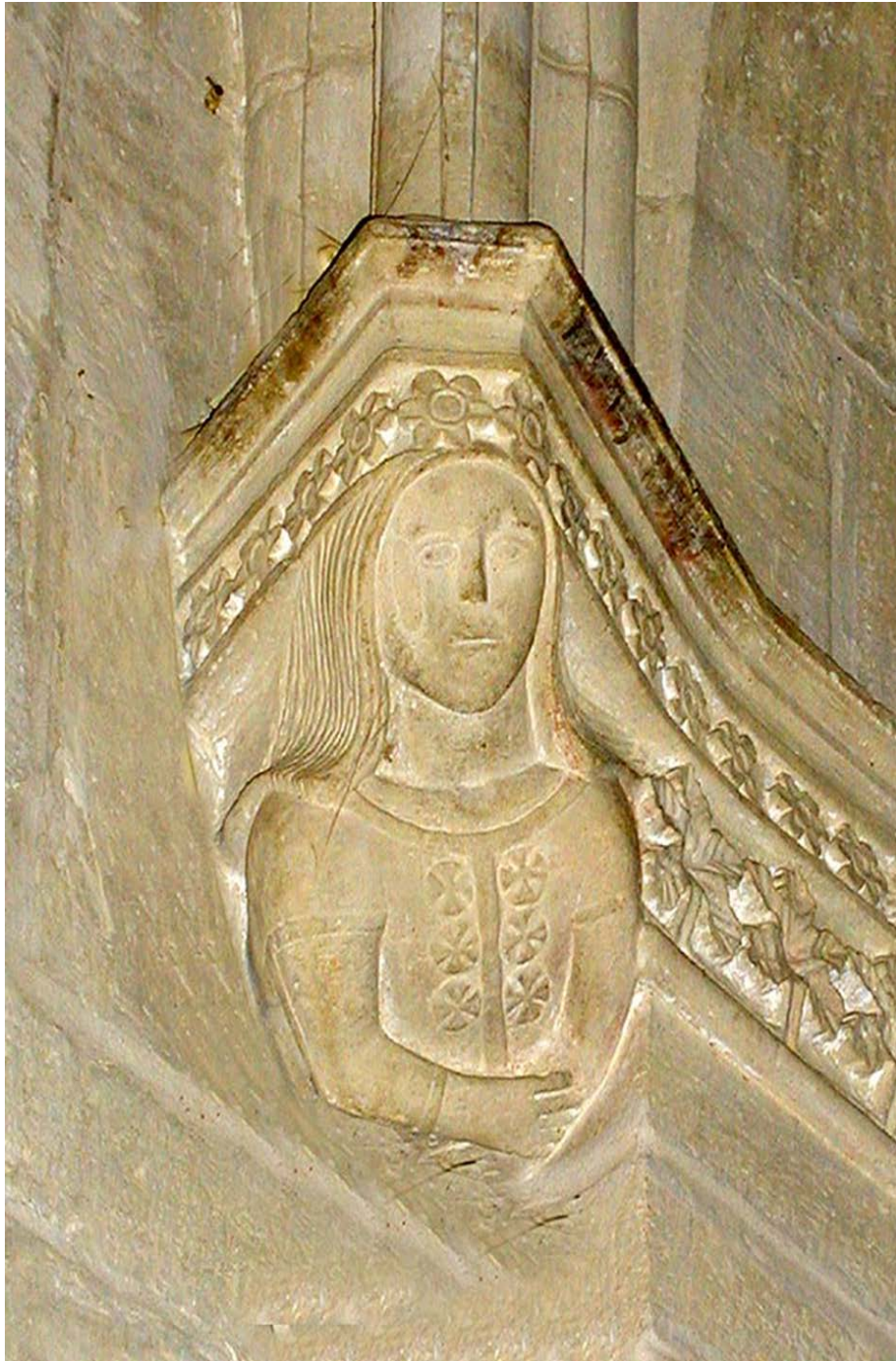
Fig. 3 - Retrato de Leonor de Arborea, detalle arquitectónico de la iglesia de San Gavino en S. Gavino Monreale.

El 1 de enero del año 1390 se acordó la liberación de Brancaleone Doria, que pudo dejar el castillo de Cagliari algunos días después.