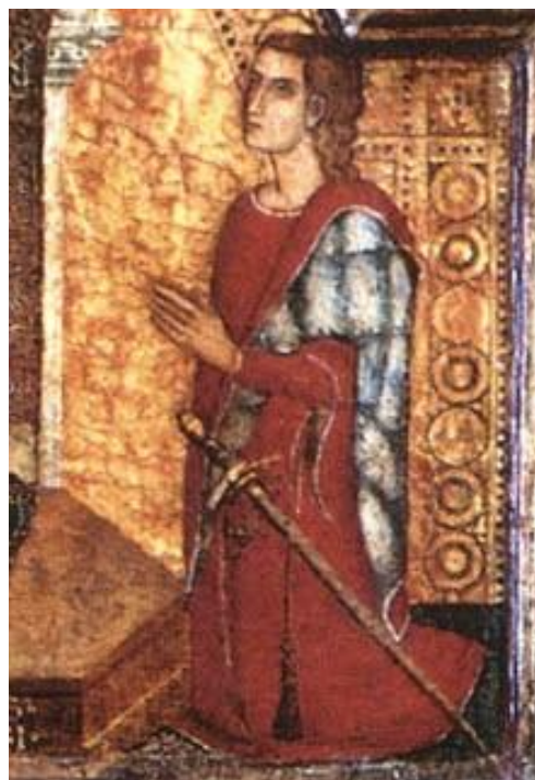
Fig. 2 - Mariano IV, detalle del político de la iglesia de S. Nicola de Ottana (de ortu 2011, portada).

Los acontecimientos se precipitaron y Leonor volvió a abrir las heridas contra los aragoneses. La decisión de continuar con la guerra surgió en el momento en el que Brancaleone se encontraba en Barcelona en el doble cargo de súbdito fiel del Rey de Aragón y de marido de la jueza rebelde de Arborea. Pedro IV ordenó arrestar a Brancaleone y, durante los primeros meses de 1384, lo llevaron y encerraron en Cerdeña con el fin de usarlo como instrumento de presión contra Leonor. Querían acordar rápidamente un tratado de paz favorable para Aragón, además de que entregaran como rehén al pequeño juez Federico a cambio de la libertad del marido.