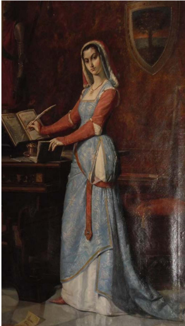
Fig. 1 - Leonor de Arborea firma la Carta de Logu, obra de Antonio Benini (finales del siglo XIX). Oristano, Palacio Campus Colonna.

Sin embargo, mientras que Leonor quería ejercitar total soberanía en el interior de sus territorios en el nombre de la antigua autonomía del Juzgado, la Corona de Aragón intentaba introducir su poder en el interior de un vínculo vasallático.