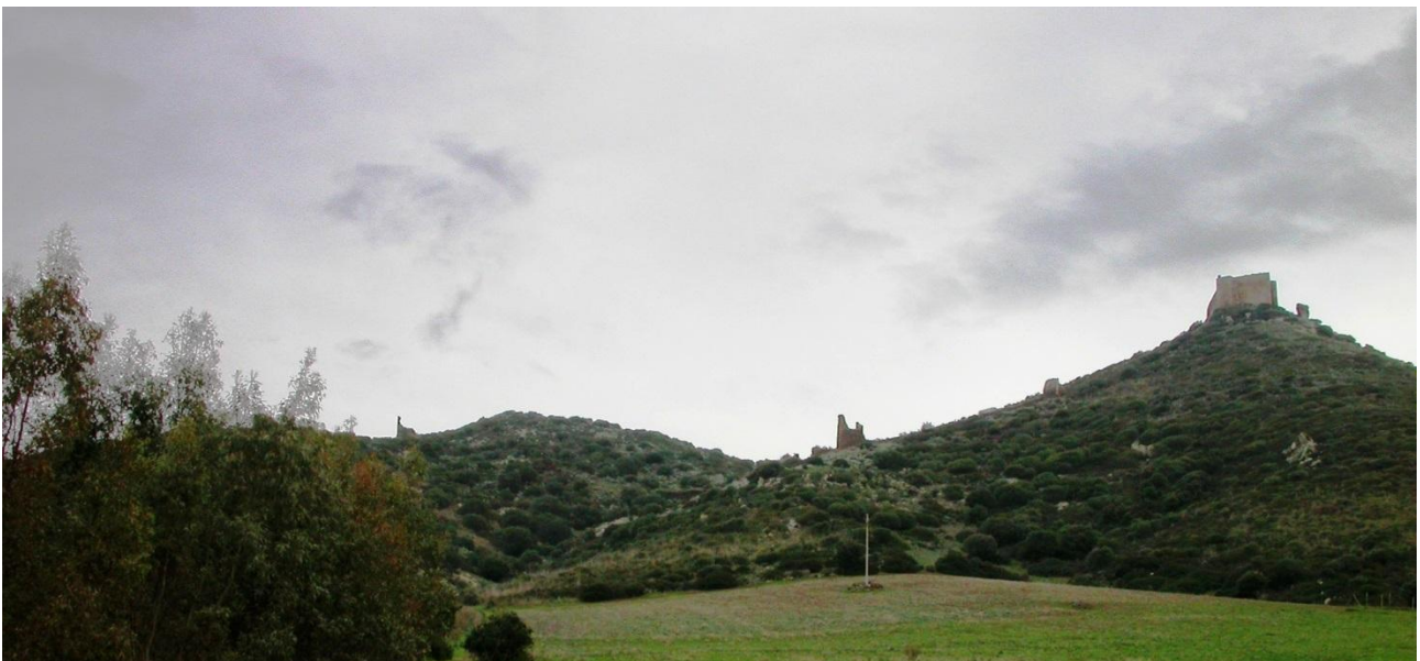
Fig. 1- La colina y el complejo fortificado de Monreale.

El torreón se encuentra en la cima de una colina con unas laderas empinadas, a una altura de 387 metros sobre el nivel del mar (fig. 1). Han sobrevivido los muros perimetrales de la fortaleza, con una altura aproximada de 10 metros y una superficie interna de 720 metros cuadrados (fig. 2). Desde el punto de vista de la planimetría, la forma del edificio es parecida a un trapecio irregular alargado, con los lados norte y sur paralelos entre ellos, y el occidental oblicuo en relación con los dos primeros. La entrada, que se encuentra en la esquina donde se unen los muros perimetrales sur y oeste, da acceso al interior del torreón. Este está formado por varios ambientes: cinco en el muro norte; dos en el sur; uno en el lado sureste; y un espacio que se ha interpretado como una torre en el lado nororiental (fig. 3). Estos espacios, de los que ha sobrevivido sólo la planta baja, se desarrollaban en más niveles como lo demuestran los orificios que albergaban el suelo de madera de los niveles superiores. En las paredes perimetrales no hay aberturas, por lo que los ambientes de la planta baja y de los pisos superiores se iluminaban exclusivamente a través de las ventanas que daban al patio interno. El edificio se construyó con una técnica de aparejo irregular, realizada con piedras pequeñas de esquisto local, traquita, granito y caliza, unido mediante una capa gruesa de mortero.