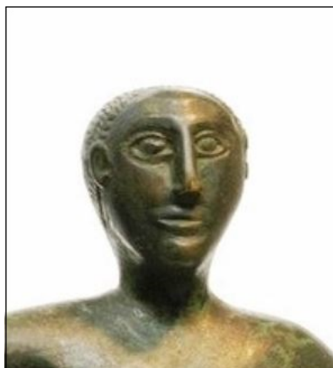
Fig. 2 - Detalle de la estatua.