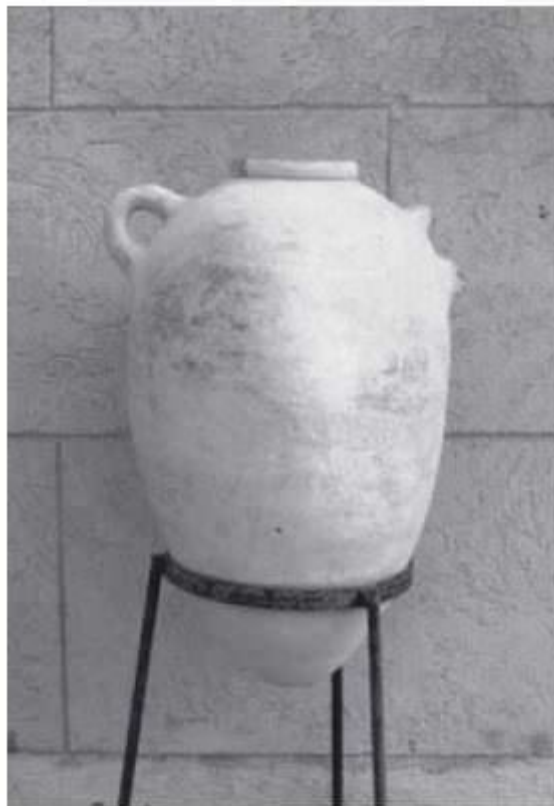
Fig. 3 - Ánfora de tipo T-3.1.1.2. de Ramón, Motia (de TOTI 2003, lám. CCIV, fig. 2).