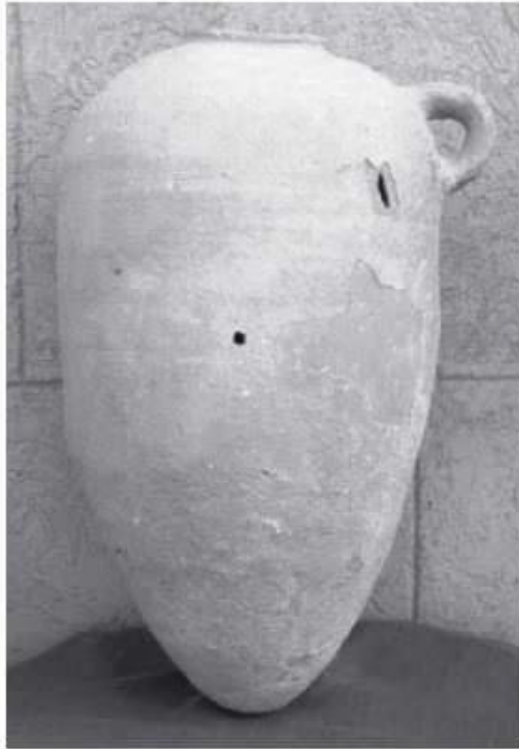
Fig. 2 - Ánfora de tipo T-3.1.1.2. de Ramón, Motia (de TOTI 2003, lám. CCIV, fig. 1).