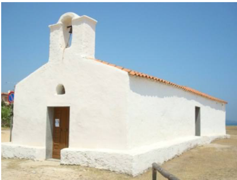
Fig. 3 - Iglesia de San Giovanni, identificable con la Ecclesia Sancti Johannis de Portunono, según fuentes antiguas (de http://photos.wikimapia.org/p/00/00/60/40/76_big.jpg ).