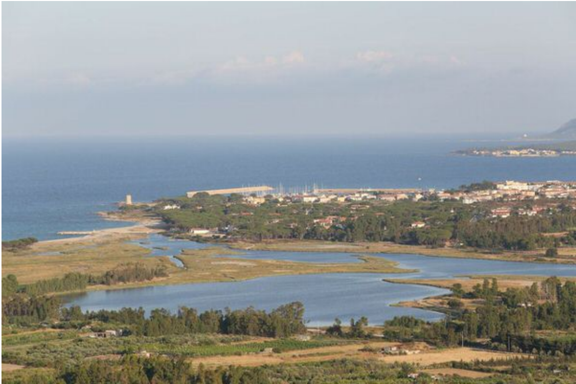
Fig. 1 - Localidad de San Giovanni de Posada vista desde el Castillo della Fava (foto de Unicity S.p.A.).