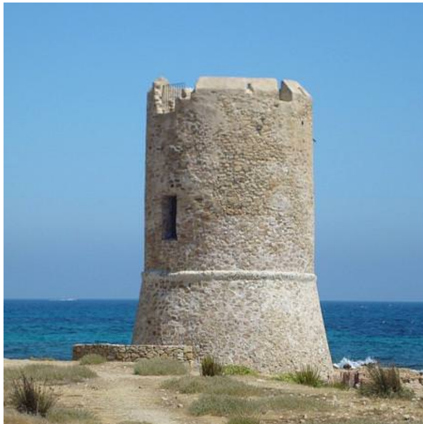
Fig. 2 - Torre de San Giovanni, en la homónima ciudad del ayuntamiento de Posada.