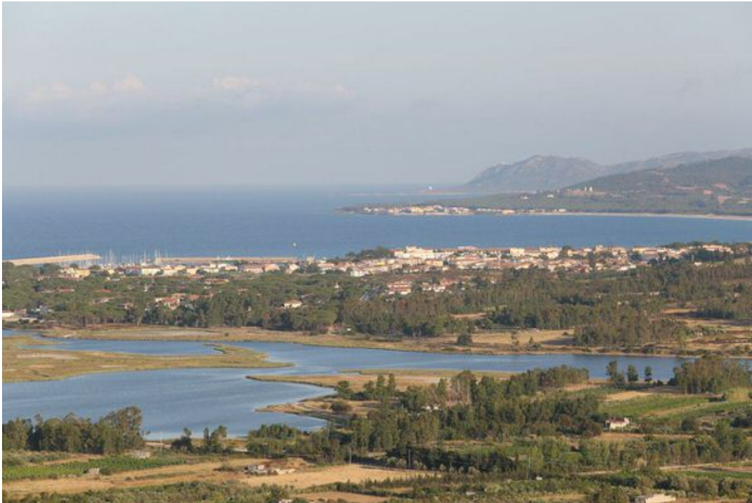
Fig. 2 - Panorámica de la costa en el sureste de Posada; en un segundo plano se observa la localidad de San Juan y, al fondo, Santa Lucía de Siniscola.