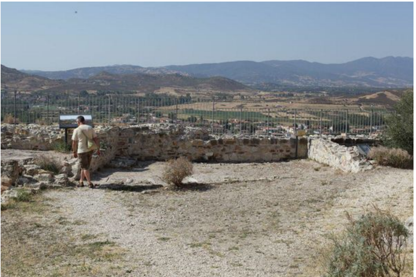
Abb. 2 - Detalle de los restos de los muros que definen las estructuras de la plaza de armas.

En el interior de la plaza de armas había 3 cisternas de agua (de tamaños variables, entre ex m y 4x10 m) que, en el caso de un asedio prologado del enemigo, garantizaban el suministro de agua en todo el Castillo della Fava. En los laterales también había otras estructuras, quizás almacenes o establos, que se encontraban también dentro de las murallas, según los modelos de construcción del siglo XIII. De estas construcciones quedan pocos restos, como algunos muros del perímetro. Muy probablemente, las cisternas contaban con una cubierta con bóveda de cañón (figs. 2-4).