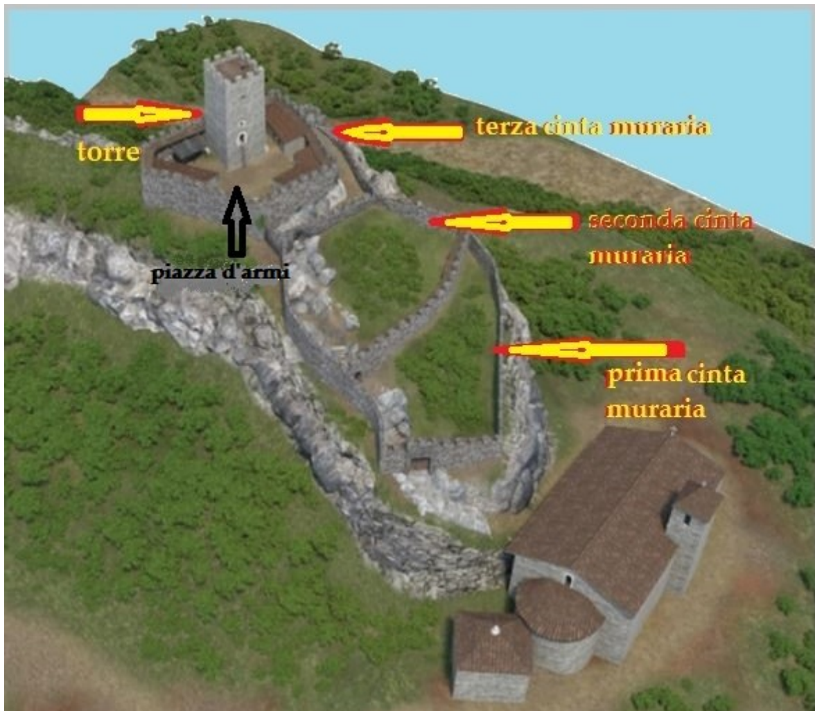
Abb. 1 - Reconstrucción del Castillo della Fava donde se indica la plaza de armas (reelaborado por M. G. Arru, reconstrucción de Unicity S.p.A.).

El Castillo della Fava estaba rodeado por tres murallas que delimitaban también tres espacios. El último de estos, en la cima de la colina, formaba la llamada "plaza de armas", es decir, el lugar donde se reunían las tropas y donde permanecía la guardia y las máquinas bélicas para defender el torreón. Se accedía a través de las escaleras (excavadas en la roca) de un portal, en cuyo centro todavía se puede ver la gran torre de planta cuadrada (fig. 1).