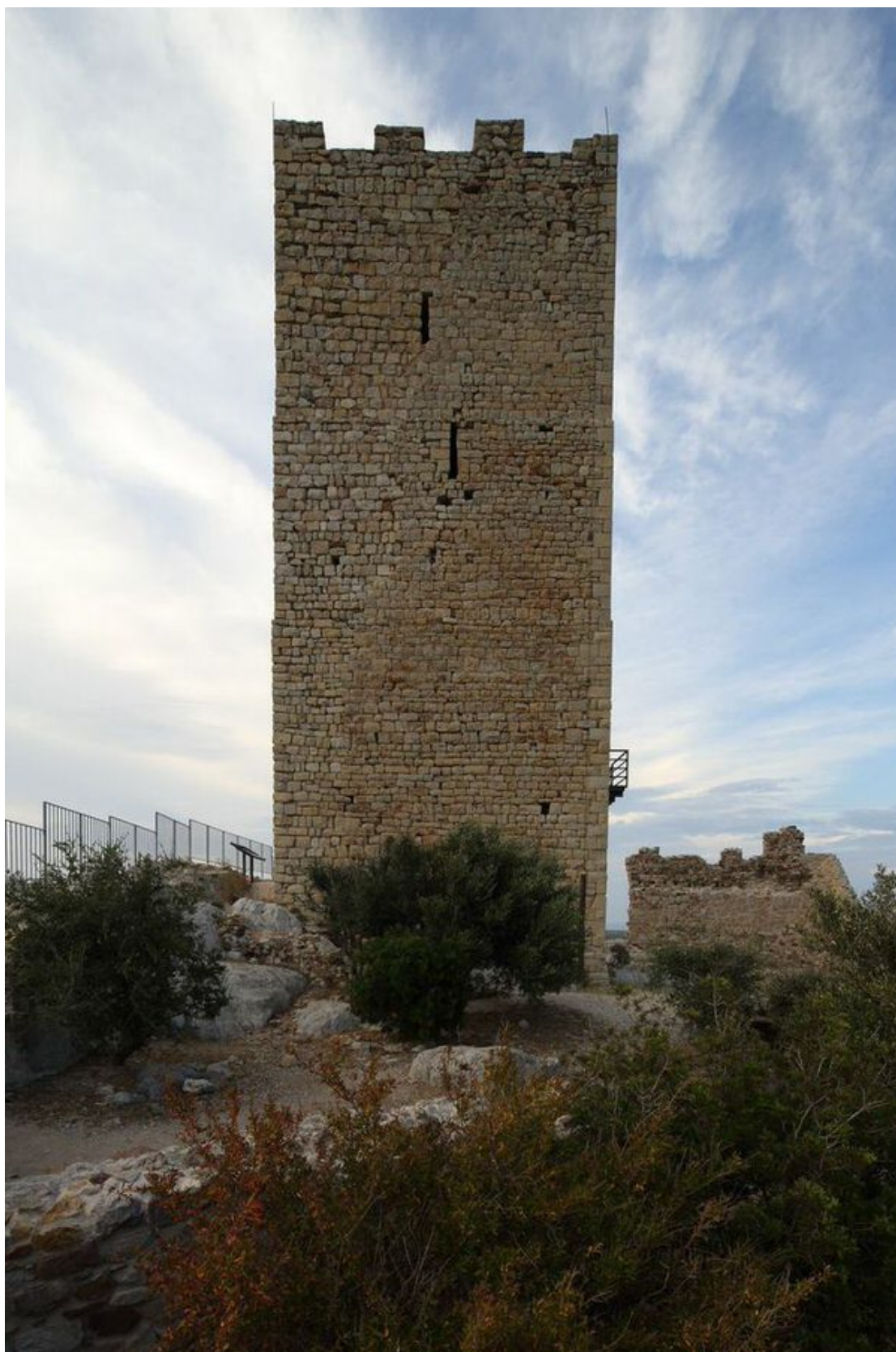
Fig. 7 - Lado sur de la torre, donde se observan dos aspilleras (foto de Unicity S.p.A.).